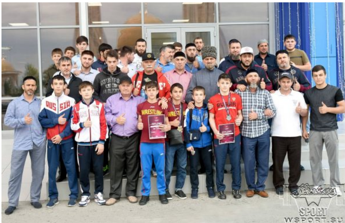
Встреча в аэропорту Грозного участников первенства Европы-18