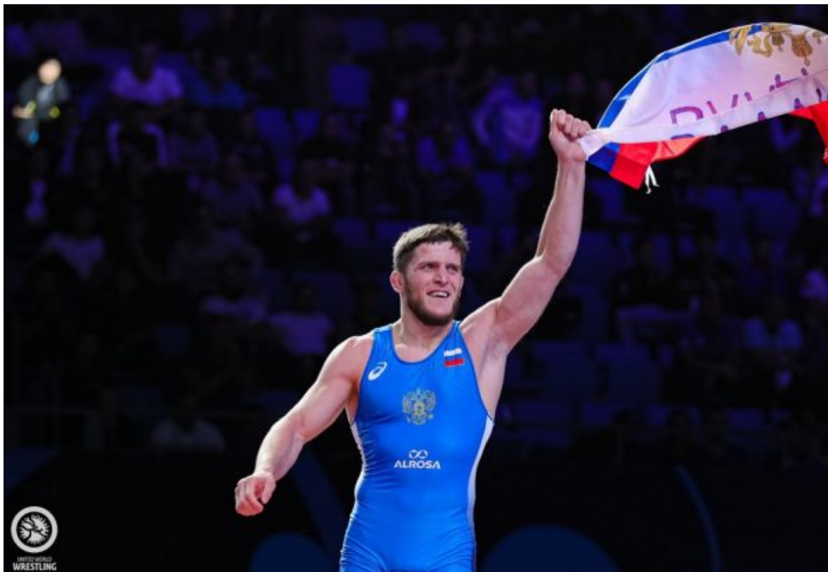
Абуязид Манцигов – чемпион мира-19