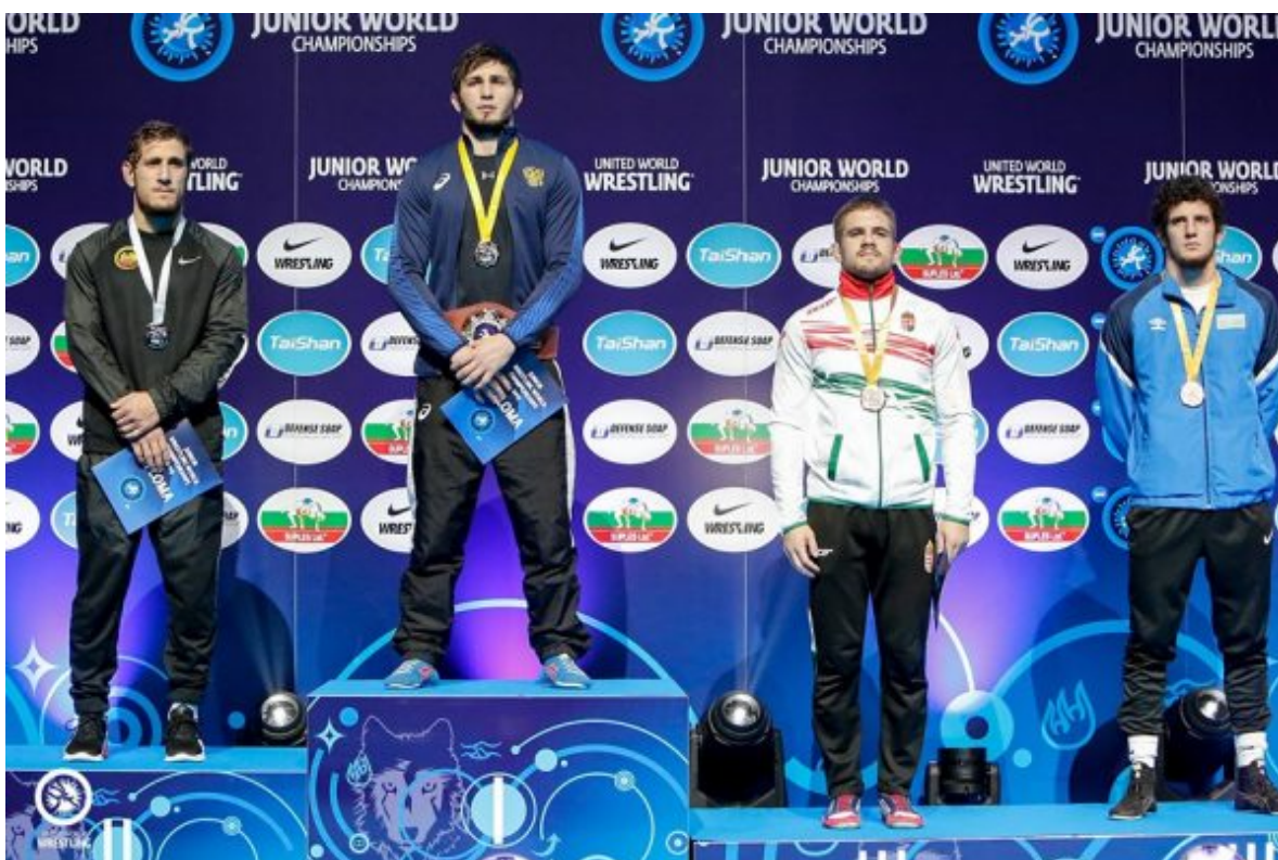
Ахмад Ташухаджиев – чемпион мира-19 среди юниоров