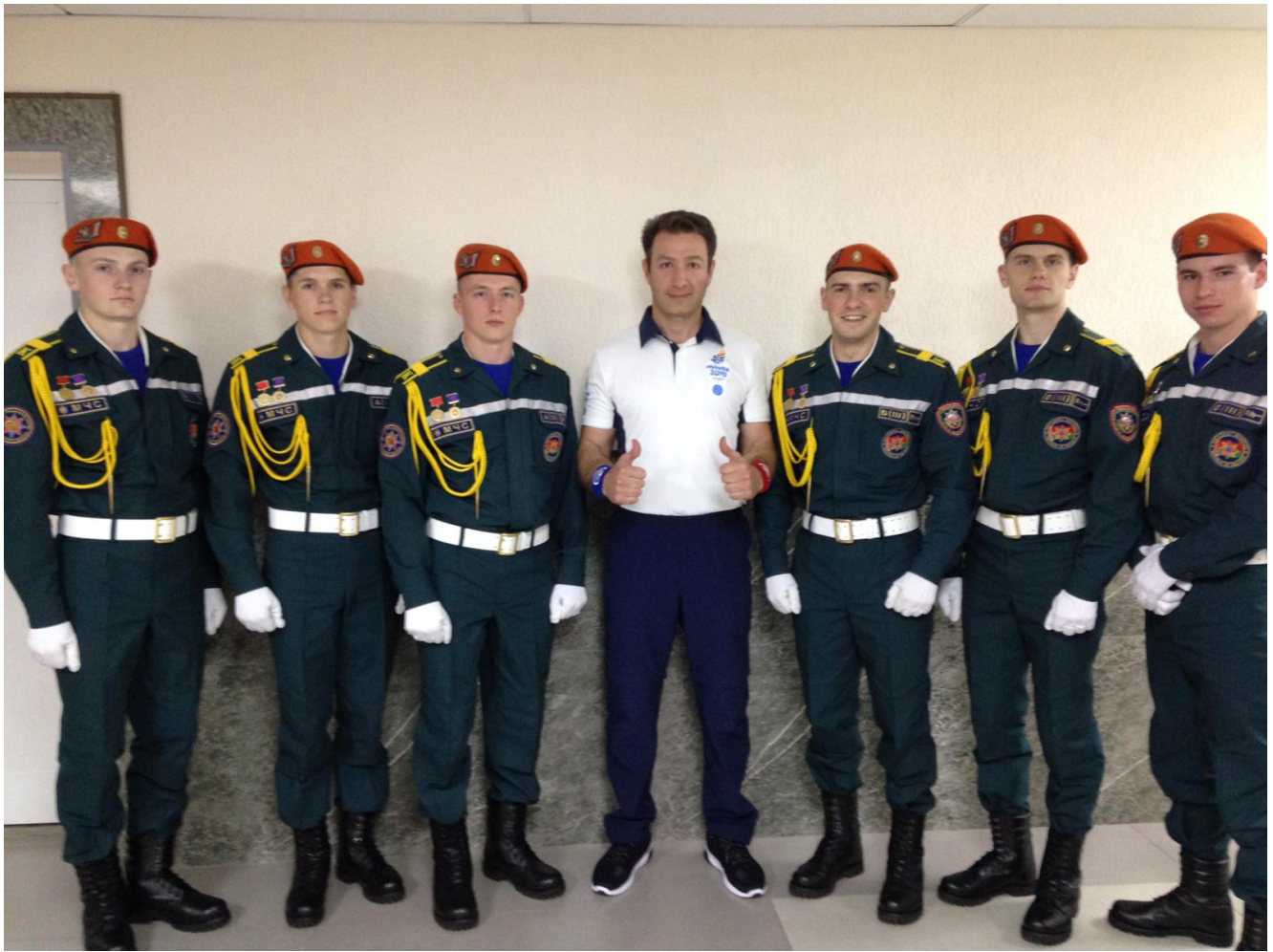
Под надежной охраной