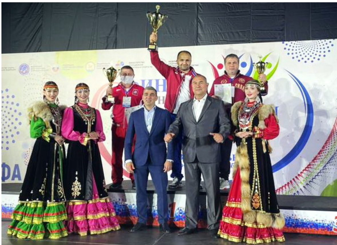
Команда Чеченской Республики заняла 3-е место в финале V летней Спартакиады молодежи России.