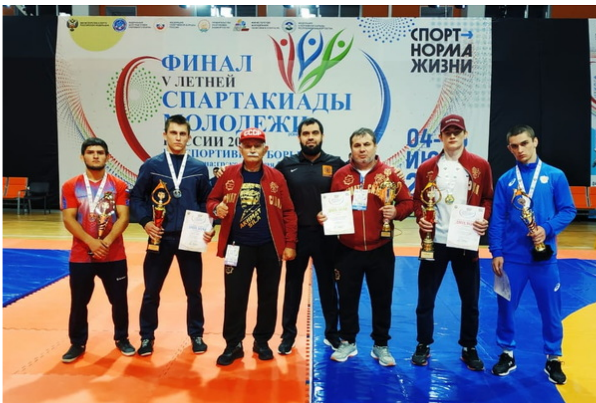
Делегация Чеченской Республики в Уфе