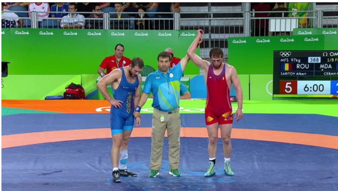
Альберт Саритов на Олимпиаде-16 в Рио.