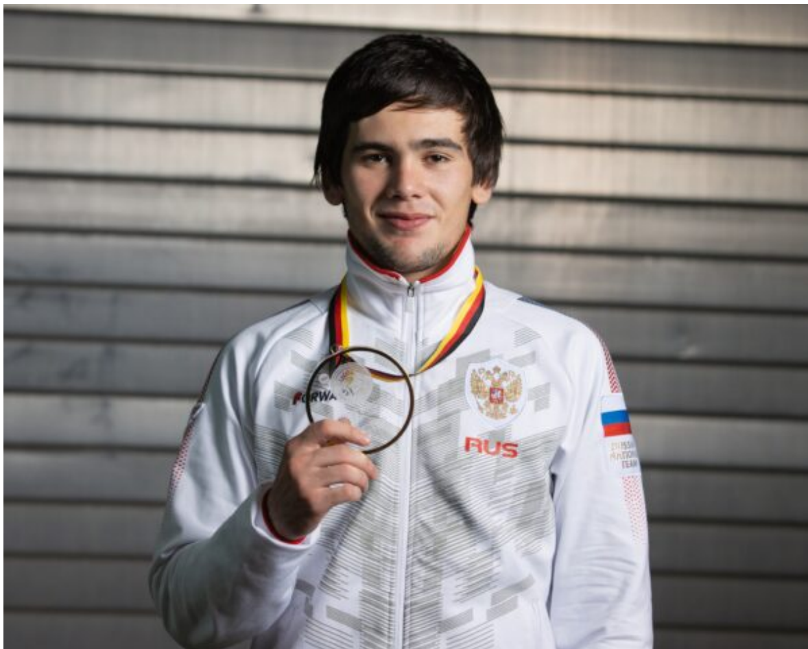
Чемпион Европы-21 среди юниоров Саид Хункеров