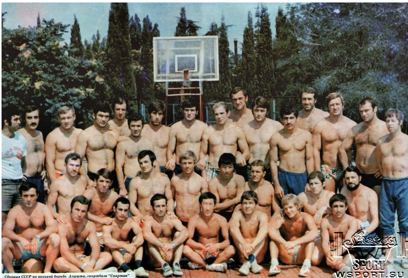
Сборная СССР по вольной борьбе. Алушта, спортбаза "Спартак"