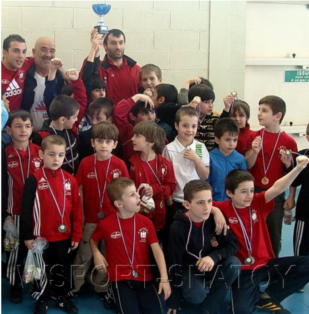
Команда "Кавигаль" берет очередной Кубок.