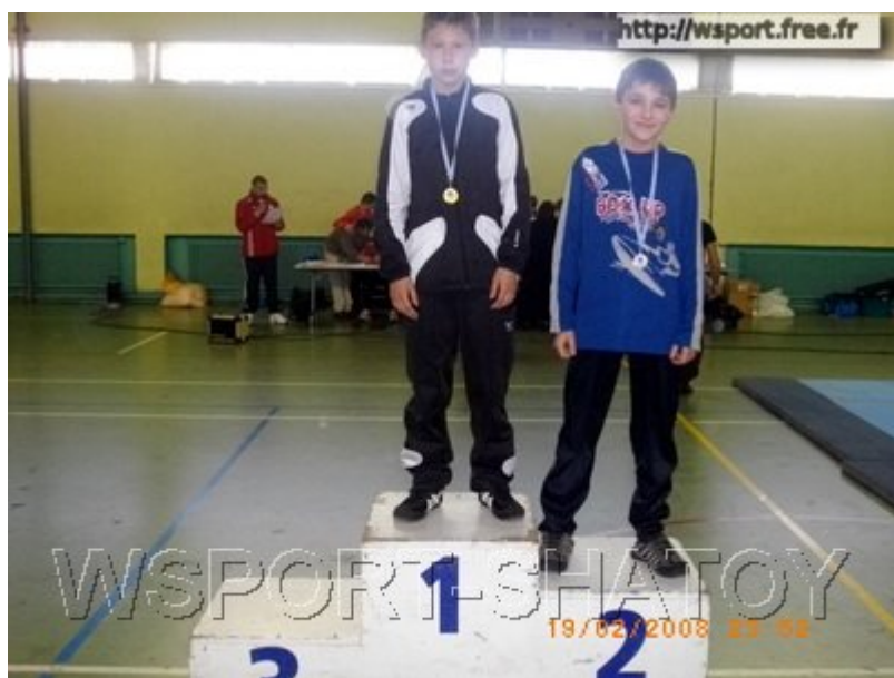
Шамиль Эсамбаев (2)