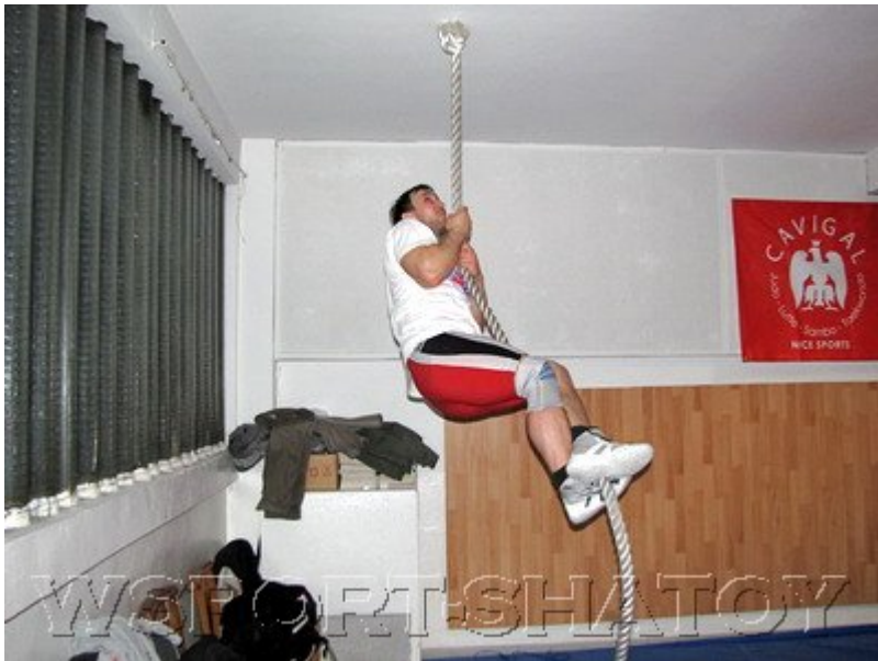
Муслим тренируется не меньше своих учеников