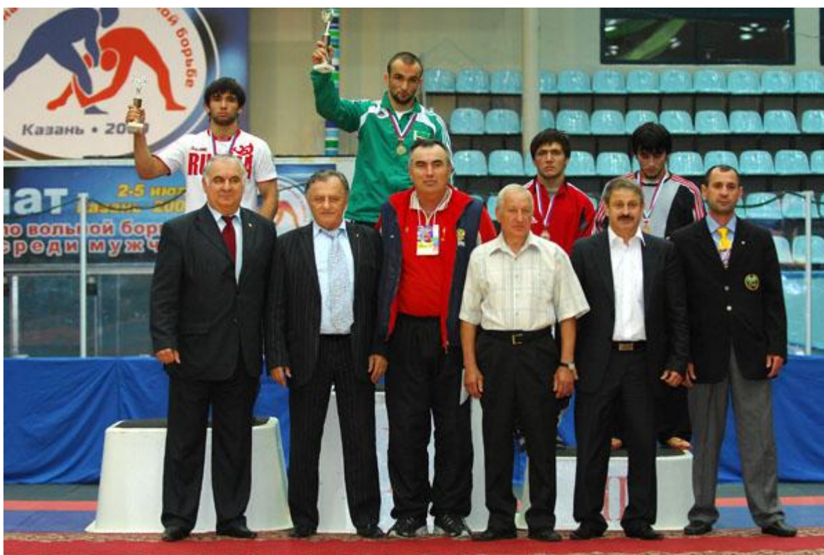
Чемпионат России 2009 года в Казани. Церемония награждения призеров весовой категории 66 кг, где чемпионом стал чеченский