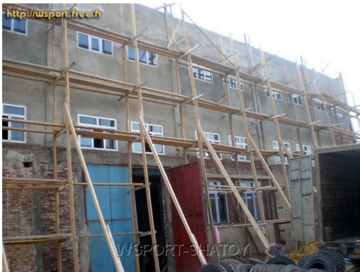
Строительство нового комплекса Школы им. братьев Сайтиевых

Ну, а сам Бувайсар и не думает успокаиваться. Некоторое время назад он взял в долгосрочную аренду большую территорию, примыкающую к школе и строит там спортивный комплекс. В скором времени Школа им.Сайтиевых значительно расширится. Новое 3-х этажное здание будет включать в себя огромный спортивный зал, гостиницу, столовую, подсобные помещения оборудованные по последнему слову науки и техники. Перспективные дети из разных сел и районов смогут жить и тренироваться в этом комплексе.