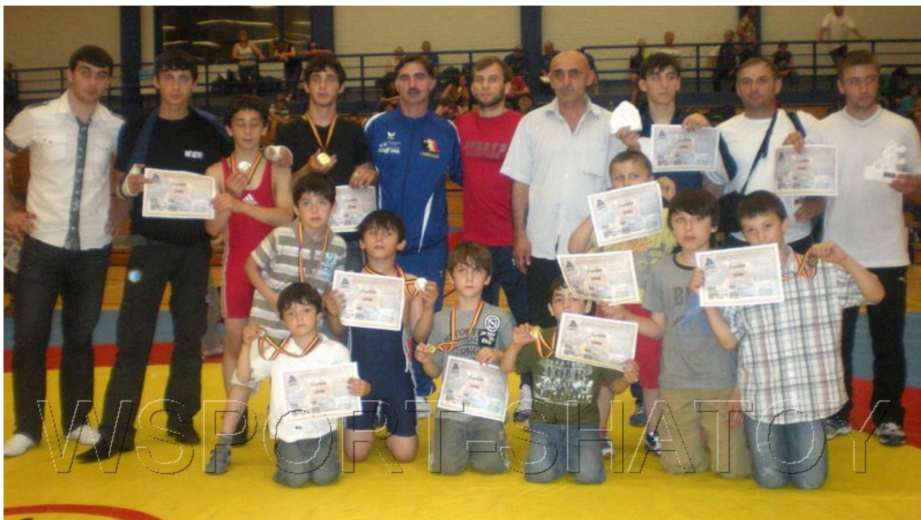
Группа чеченских тренеров и спортсменов после соревнований