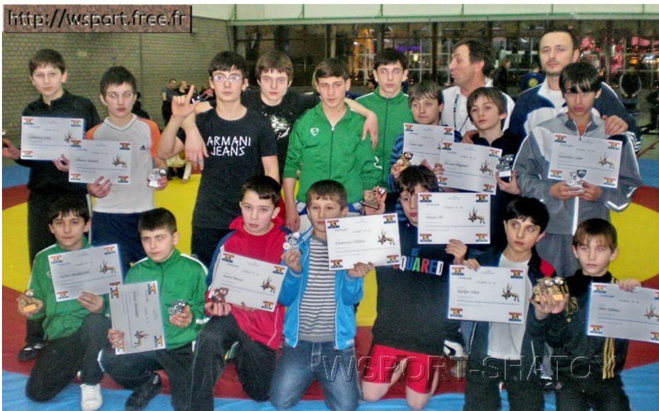
Команда спортклуба Вервье - победительница турнира