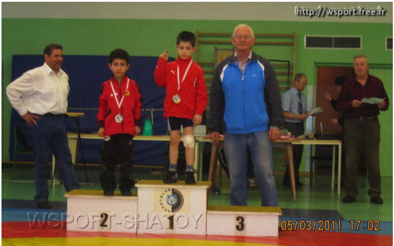
Чемпион Хамзат Раджапов