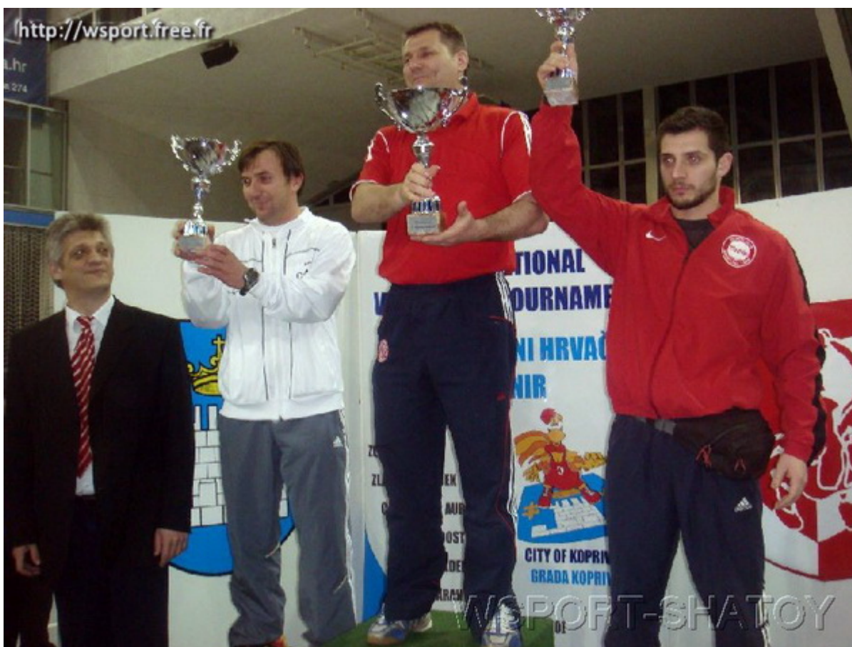
Команда из Вервье заняла второе общекомандное место