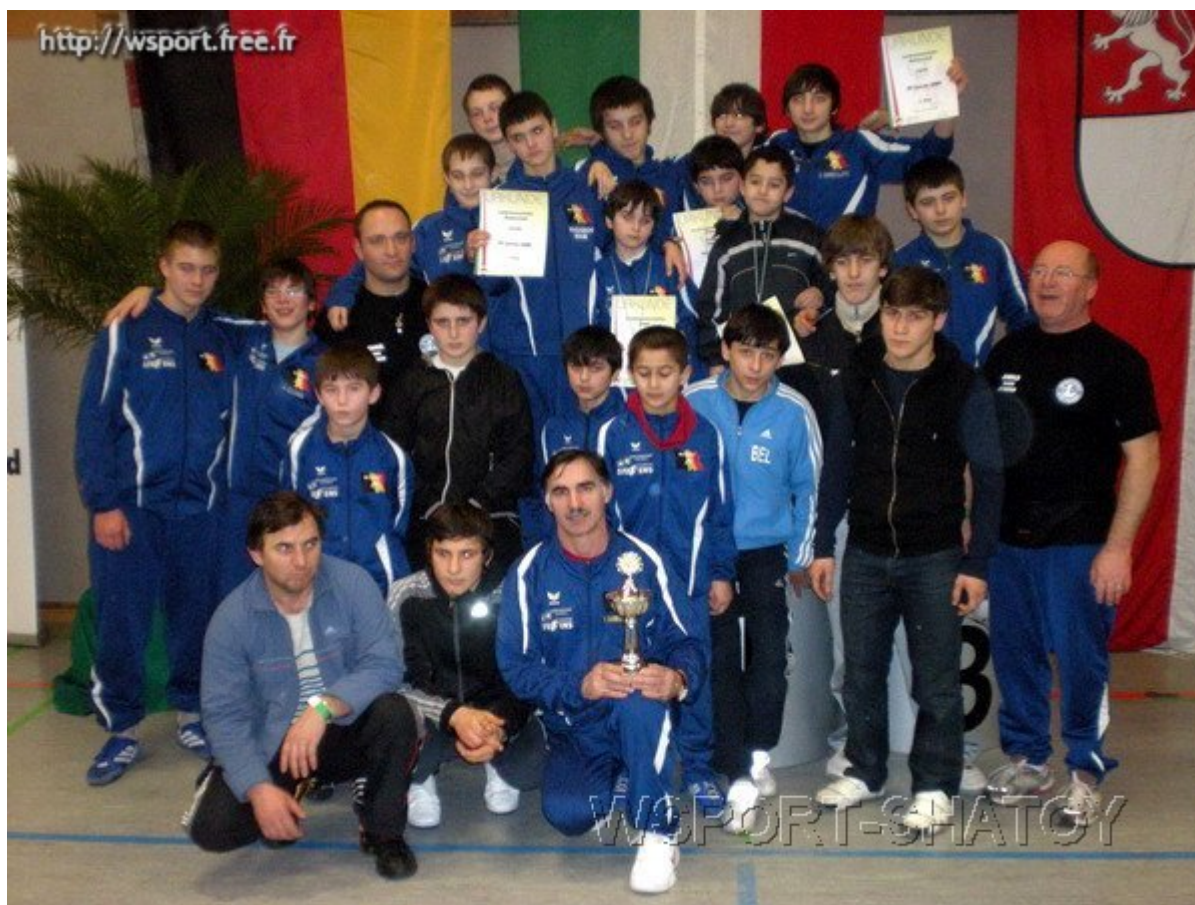
Наши в Германии