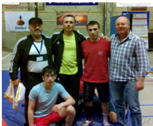
Тренер спортклуба «Олимпус»