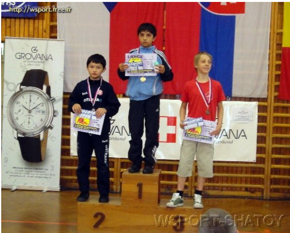
Чемпион Ислам Куркиев