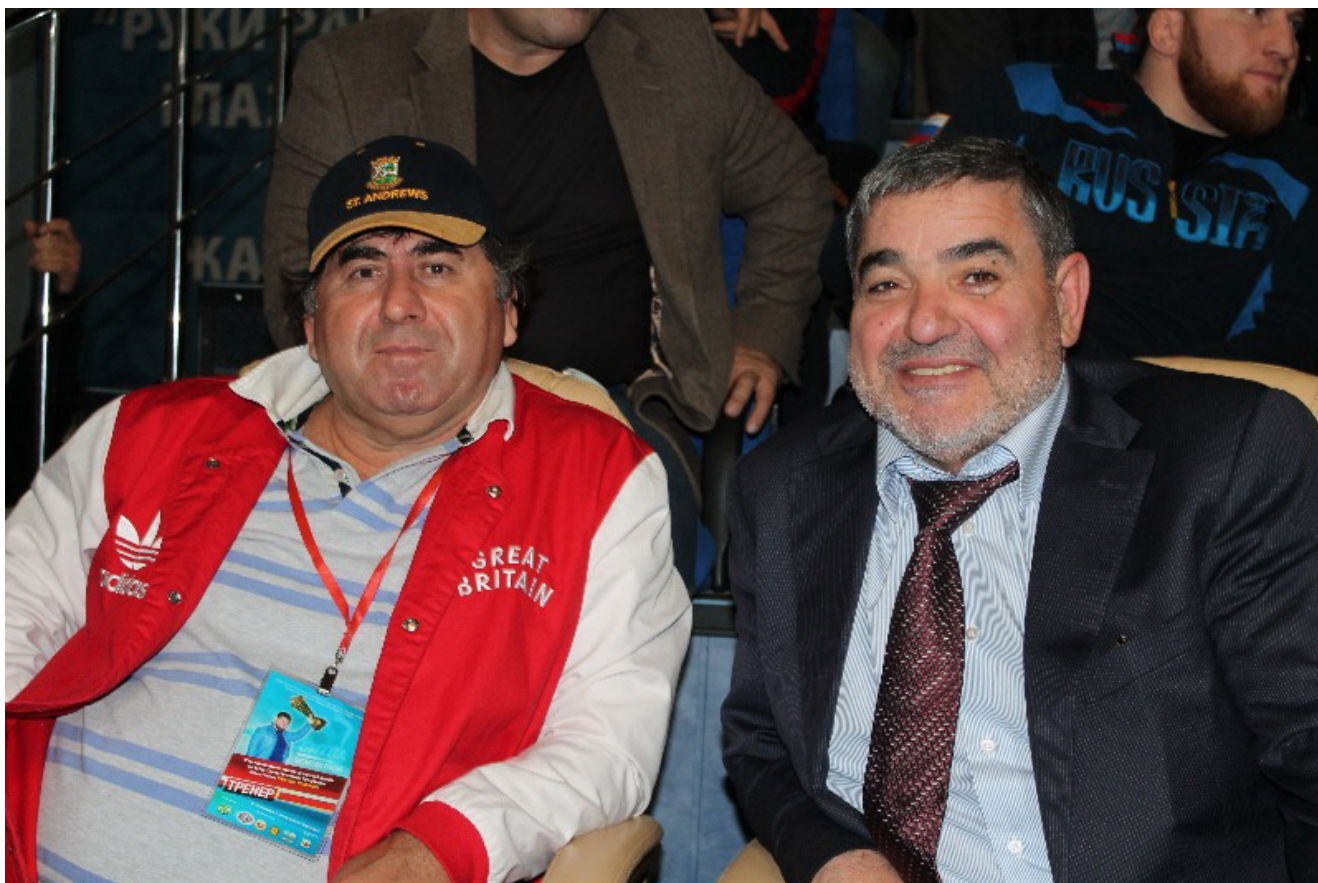
На Кубке Кадырова в Грозном, 2013г.