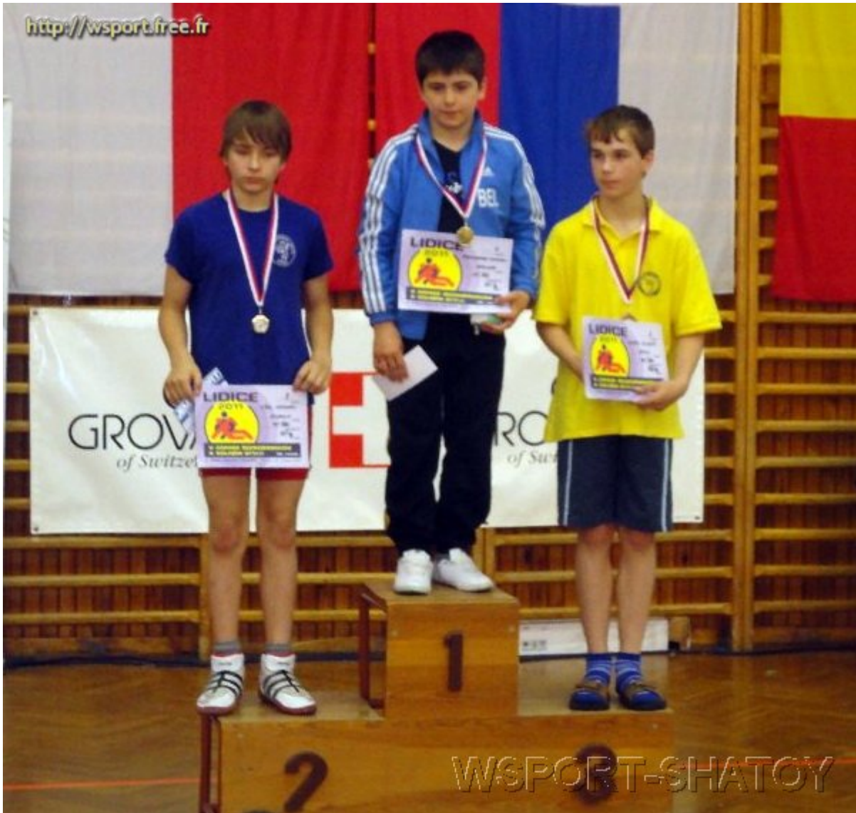
Чемпион Абубакар Тутаяв