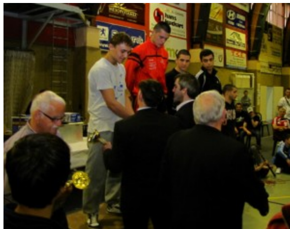
Бувайсар Сайтиев награждает призеров своей весовой категории 74 кг

Ну и конечно мне было очень интересно узнать, что обо всём этом думает сам виновник торжества. Несмотря на расписанный по-минутам график, мне удалось-таки задать Бувайсару несколько вопросов.