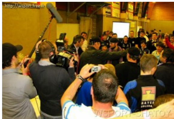
Бувайсар Сайтиев в центре внимания

А на коврах, тем временем, шли жаркие баталии. Из 150-ти заявленных участников турнира, в Эйпен смогли приехать 118 спортсменов. Они представляли 27 спортивных клубов пяти стран: Австрии, Англии, Франции, Германии и Бельгии. И большинство из них были наши соотечественники, проживающие в Европе. К сожалению, в числе не приехавших в Бельгию была и команда Чеченской республики.