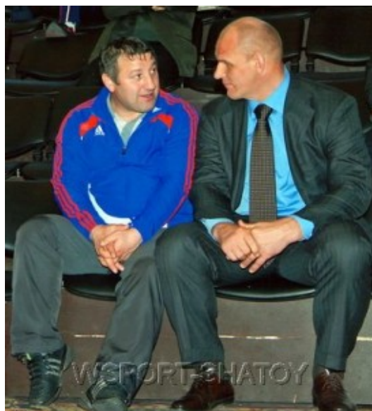
Ибрагим Шовхалов и Александр Карелин

После завершения спортивной карьеры Шовхалов не ушел из области спорта. В настоящее время он является президентом Федерации греко-римской борьбы Чеченской Республики. Его огромный опыт должен помочь в восстановлении в республике прежних победных традиций в греко-римской борьбе.