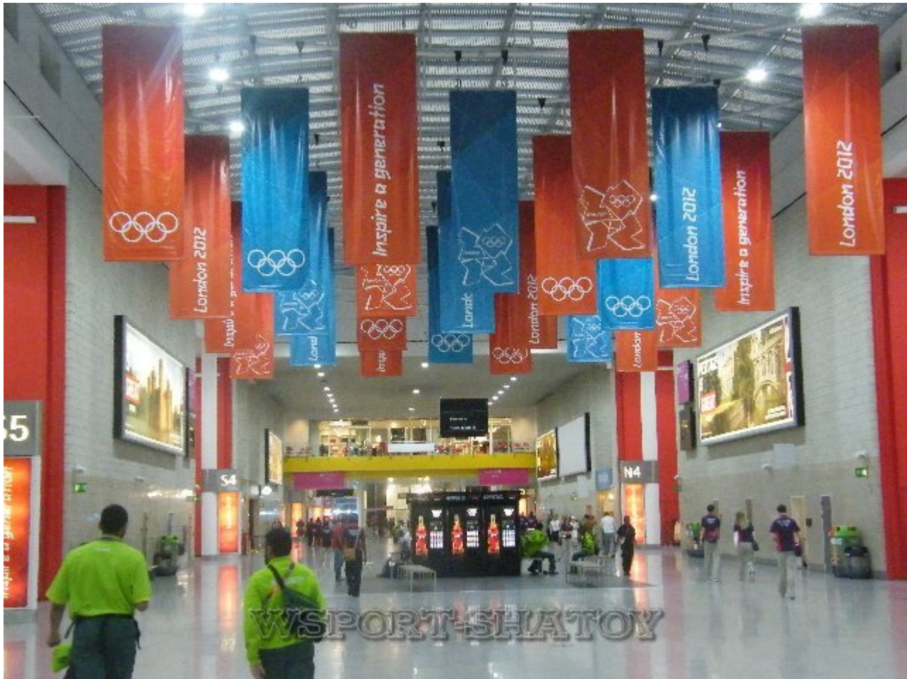
Холл Дворца спорта, где проходили соревнования борцов