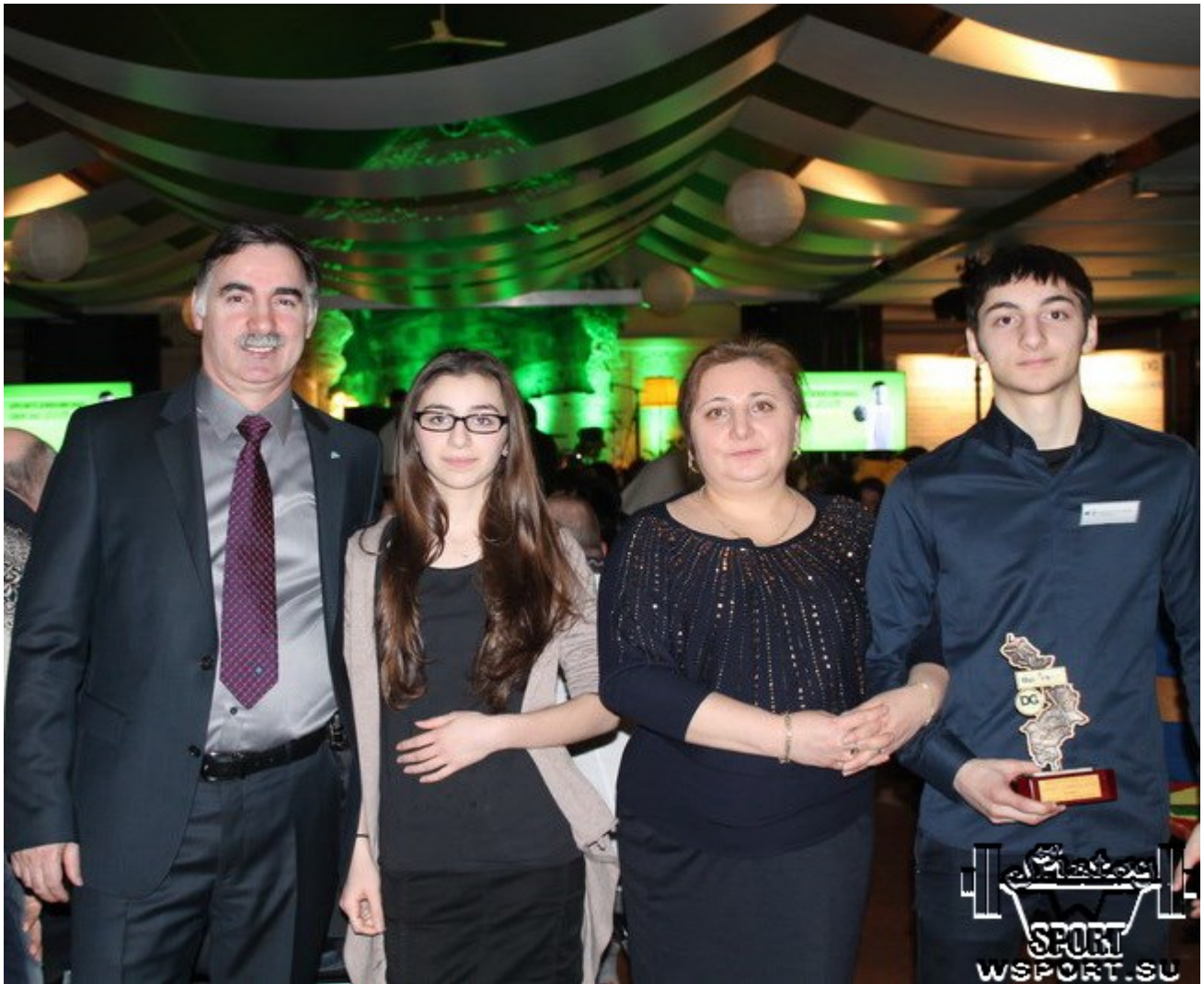
С родителями и сестрой