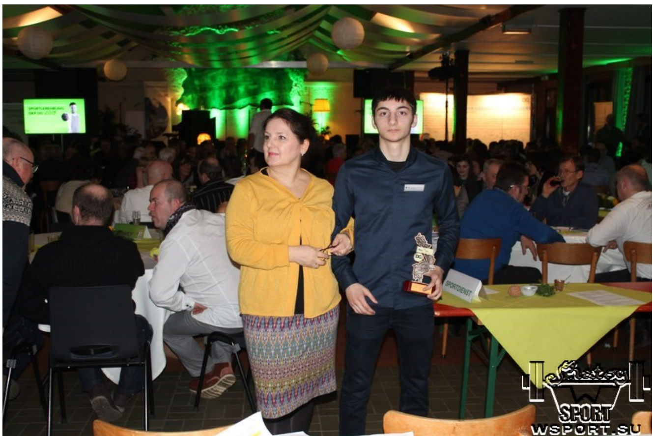
Фото с виновником торжества