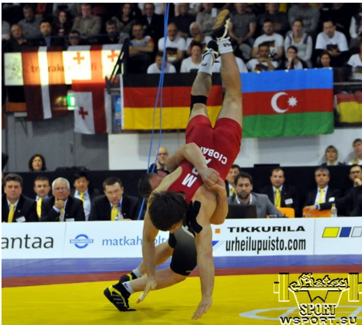
04.04.14. 20:30 Как и следовало ожидать, Абдулрашид Садулаев