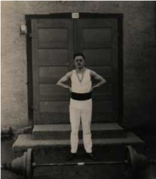
Тяжелоатлет Йоханес Ротт в 1925г.