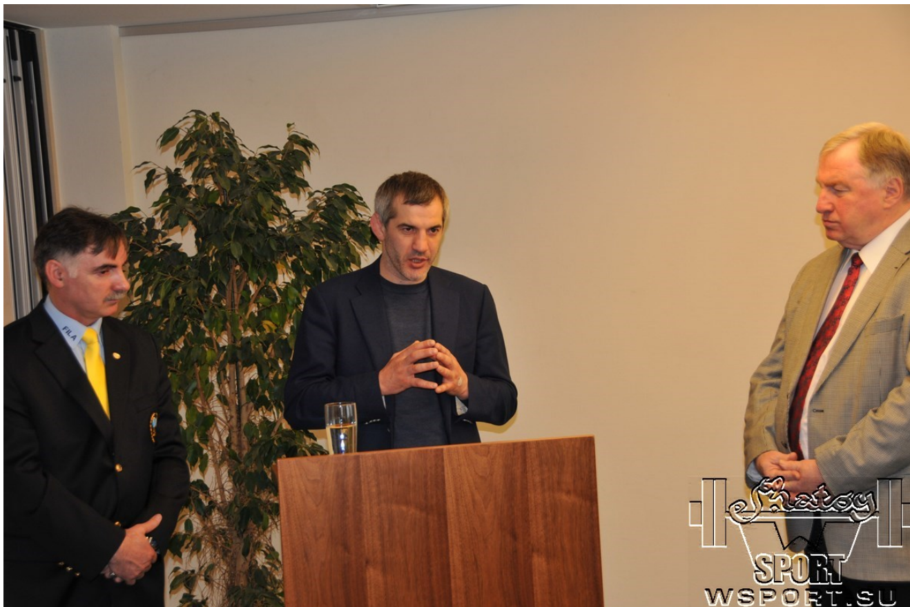
Слово взял Бувайсар Сайтиев