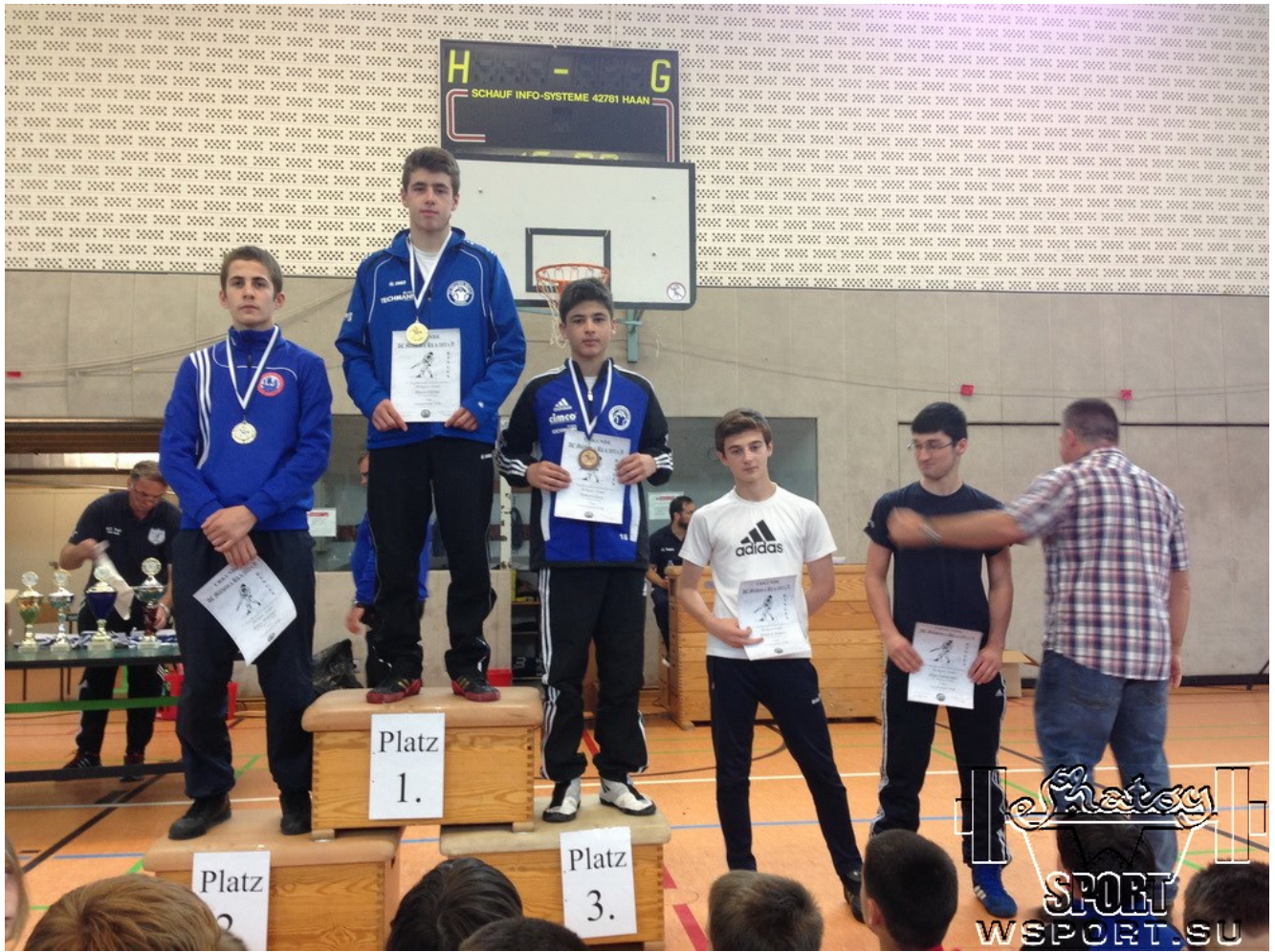
2. Бакар Алаудинов