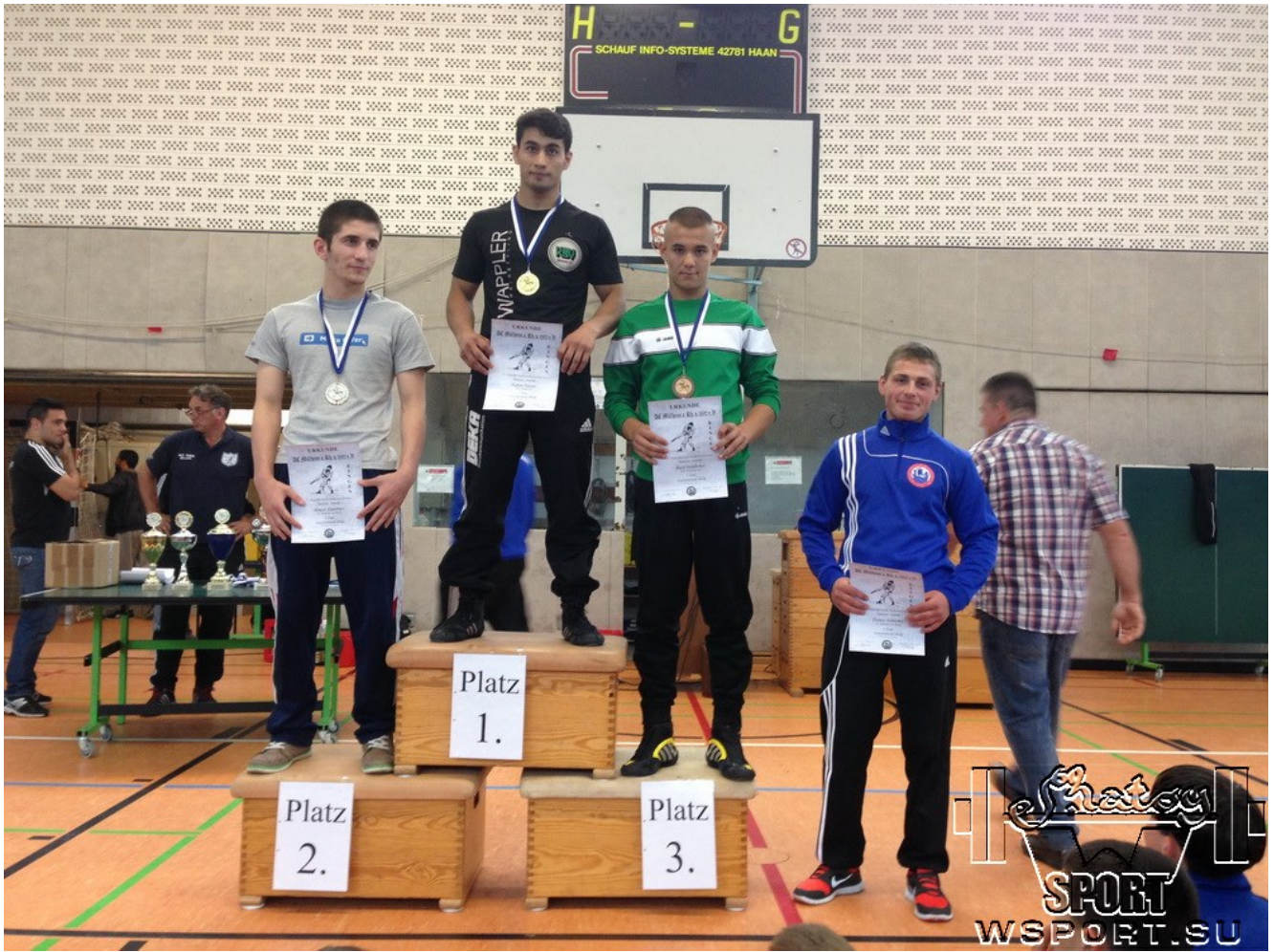
2. Ахмед Алаудинов