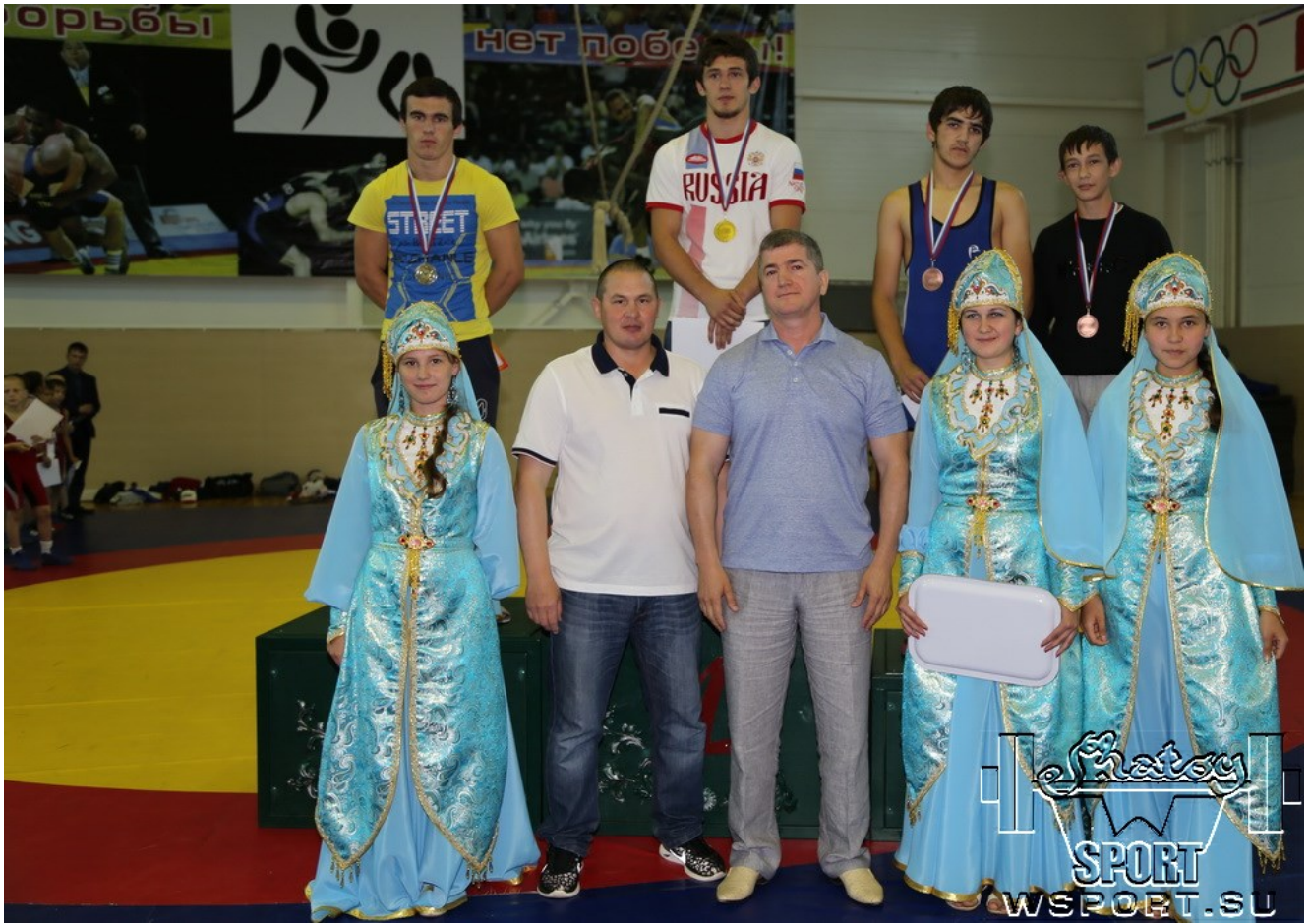
Награждение призеров III-го Всероссийского турнира "Дружба"