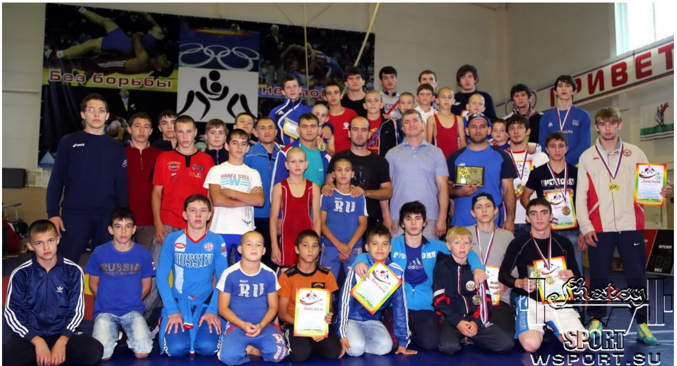
Команды Чувашии и Чечни