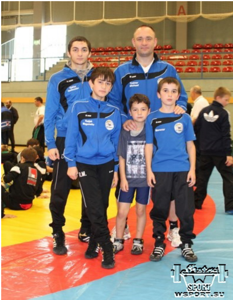
Команда Раерена из Бельгии