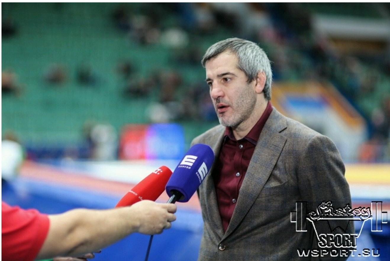
Бувайсар Сайтиев. Очередное интервью.