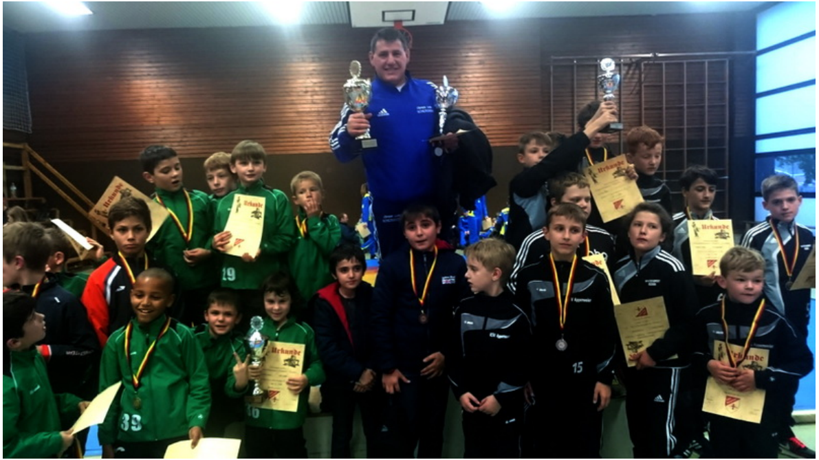
Команда из Шильтигейма, победительница турнира в Ренхене.