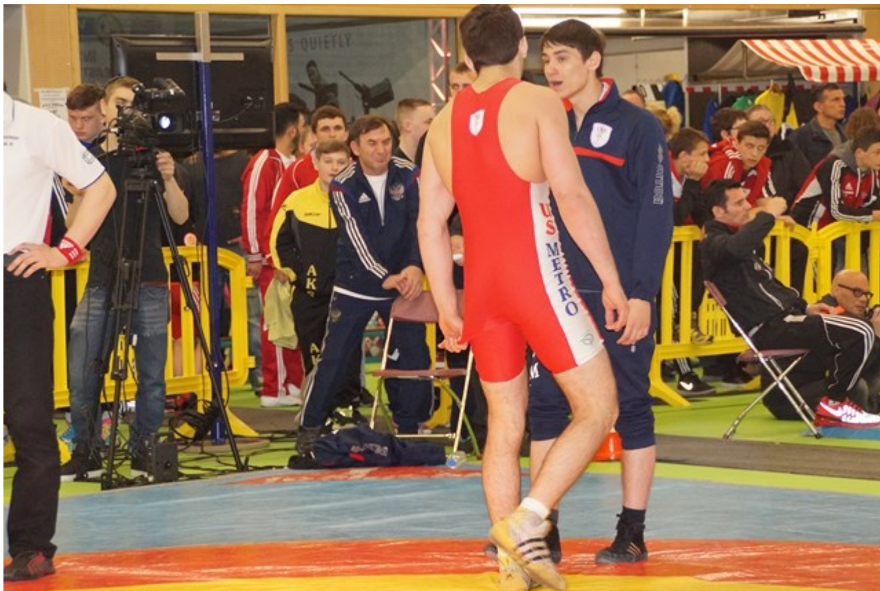
Борцы из Франции