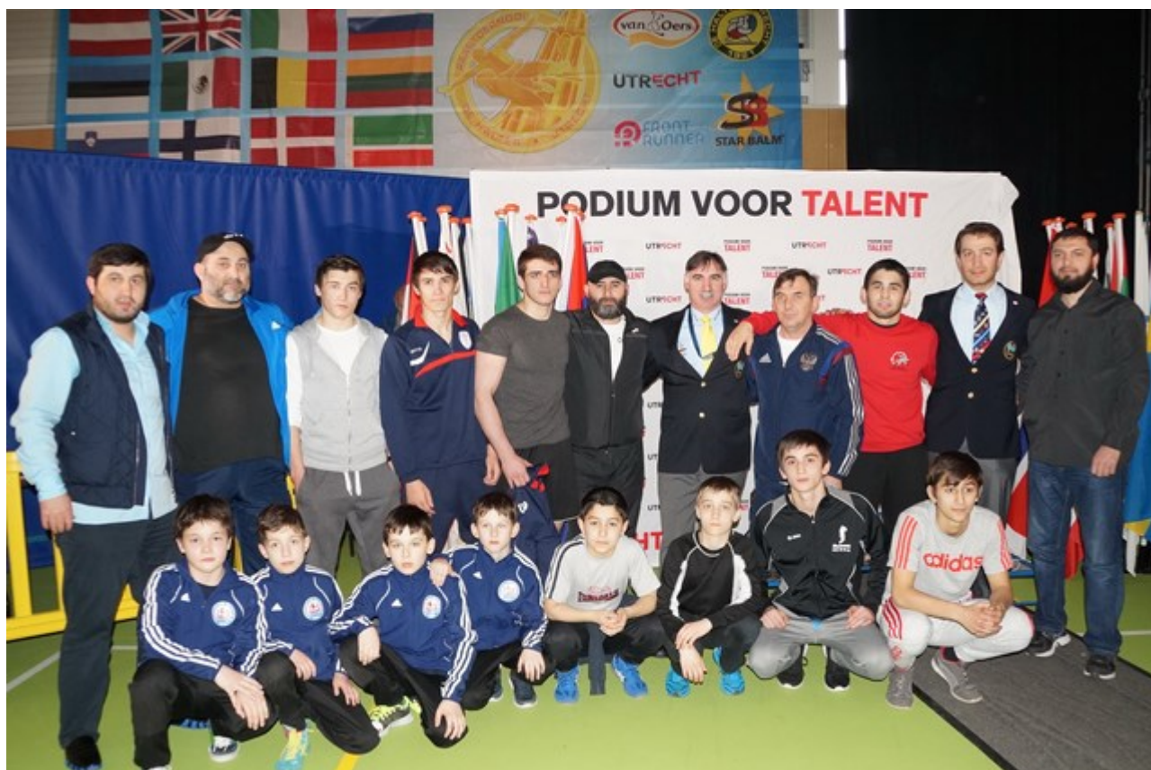
Вайнахи после турнира