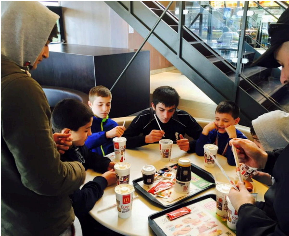
Пикник после соревнований