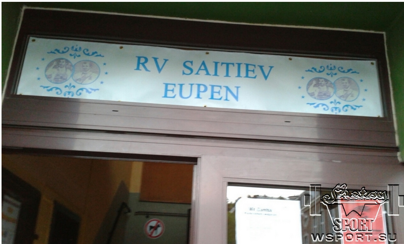
Вход в зал