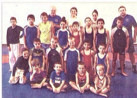
La lutte grenobloise commence à s'implanter de plus en plus. Le D.U.L.F.