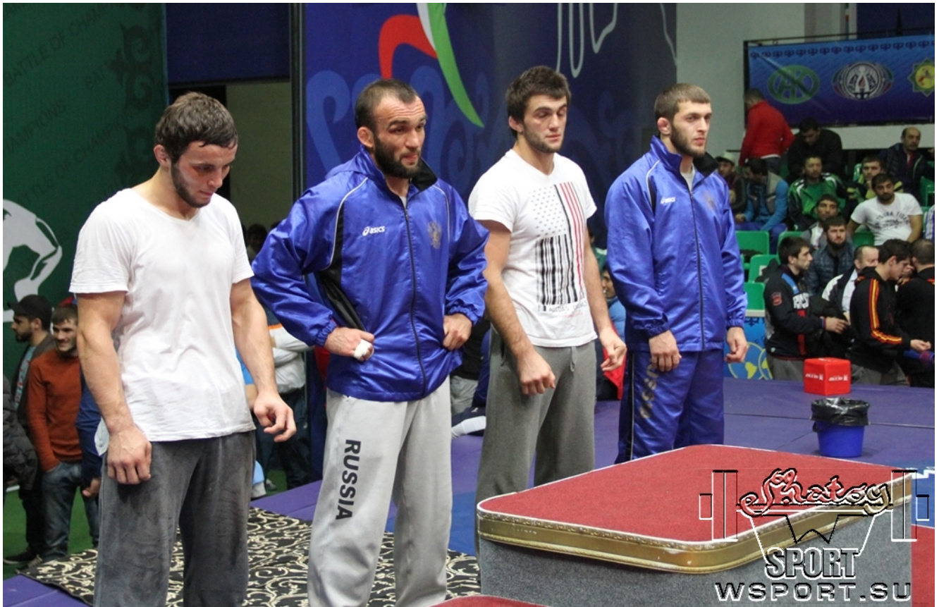
Награждение призеров категории 70 кг