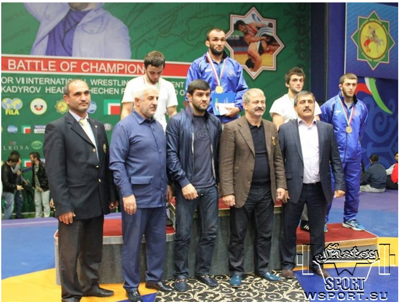
Награждение призеров категории 70 кг