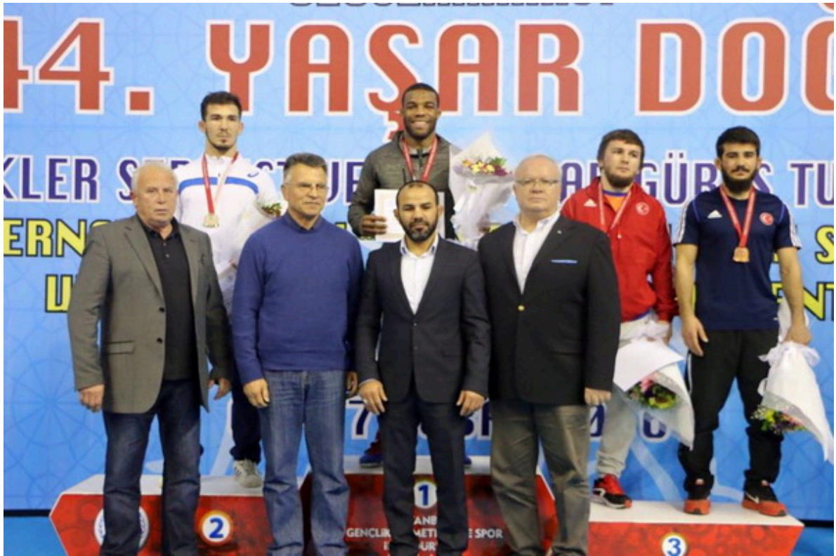
Призеры турнира Яшар Догу в 74 кг.

Видео: Зелимхан Хаджиев – Джордан Барроуз (4:25:00)