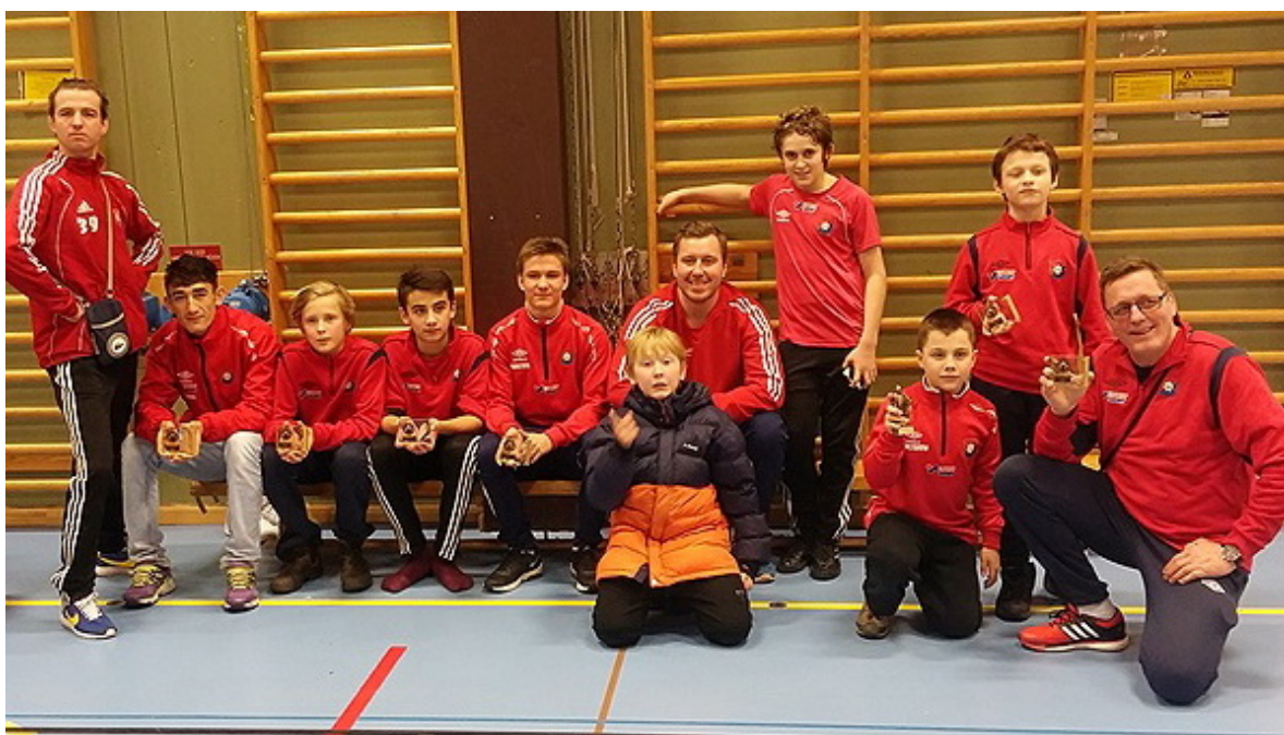
Команда из города Эргрюте