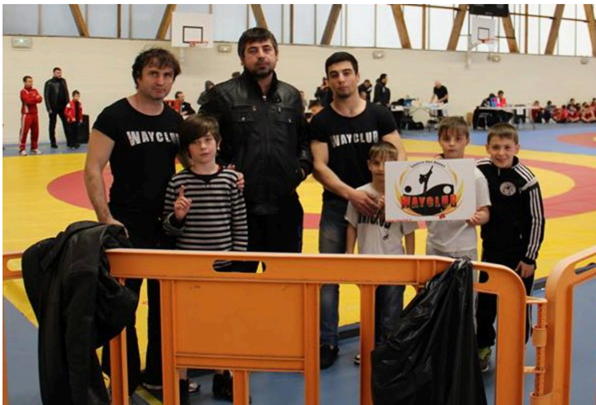
Wayclub на первенстве РАСА