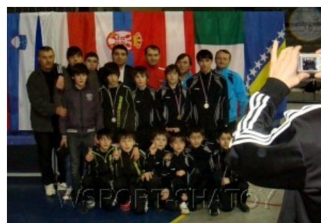
Чеченские спортсмены из