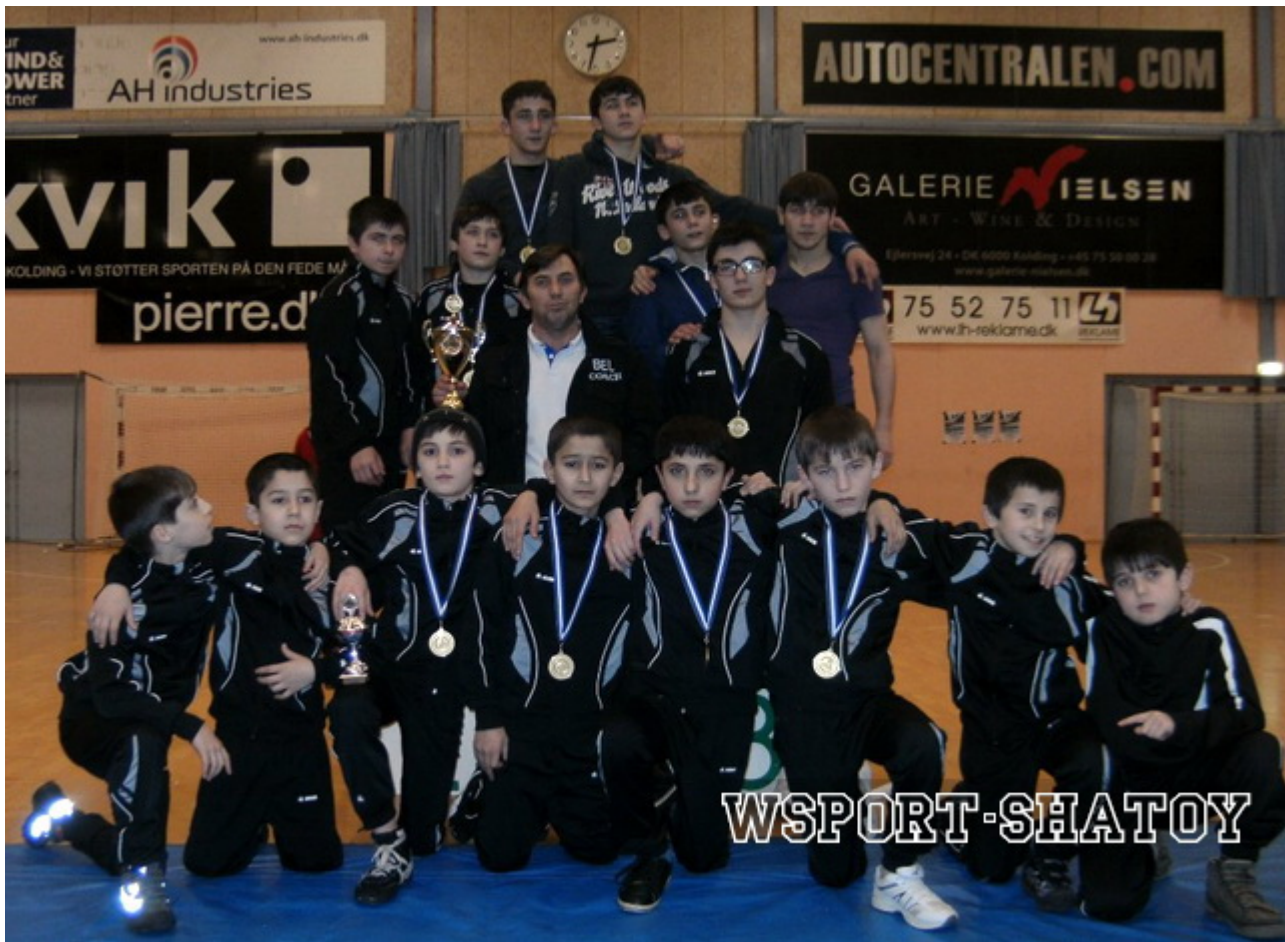
Вайнах - Вербье