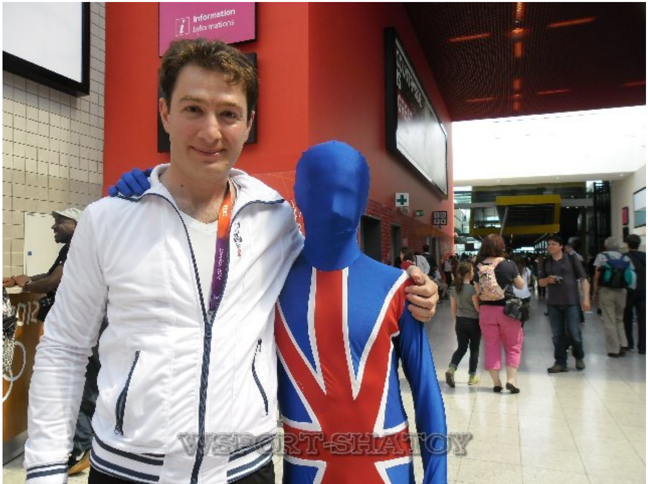
С британским болельщиком.