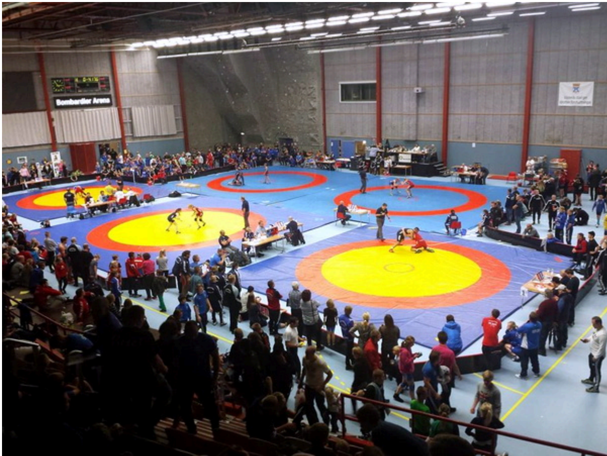
Турнир Мälarscupen проходит на 5-ти коврах