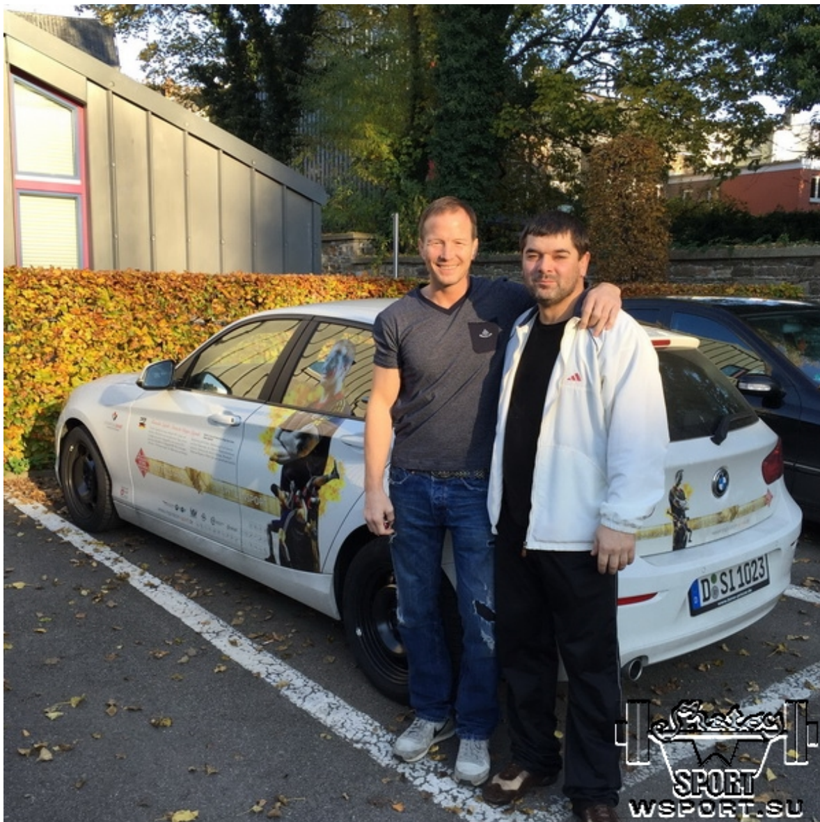
Знаменитый Александр Ляйпольд и Мурад Белоев