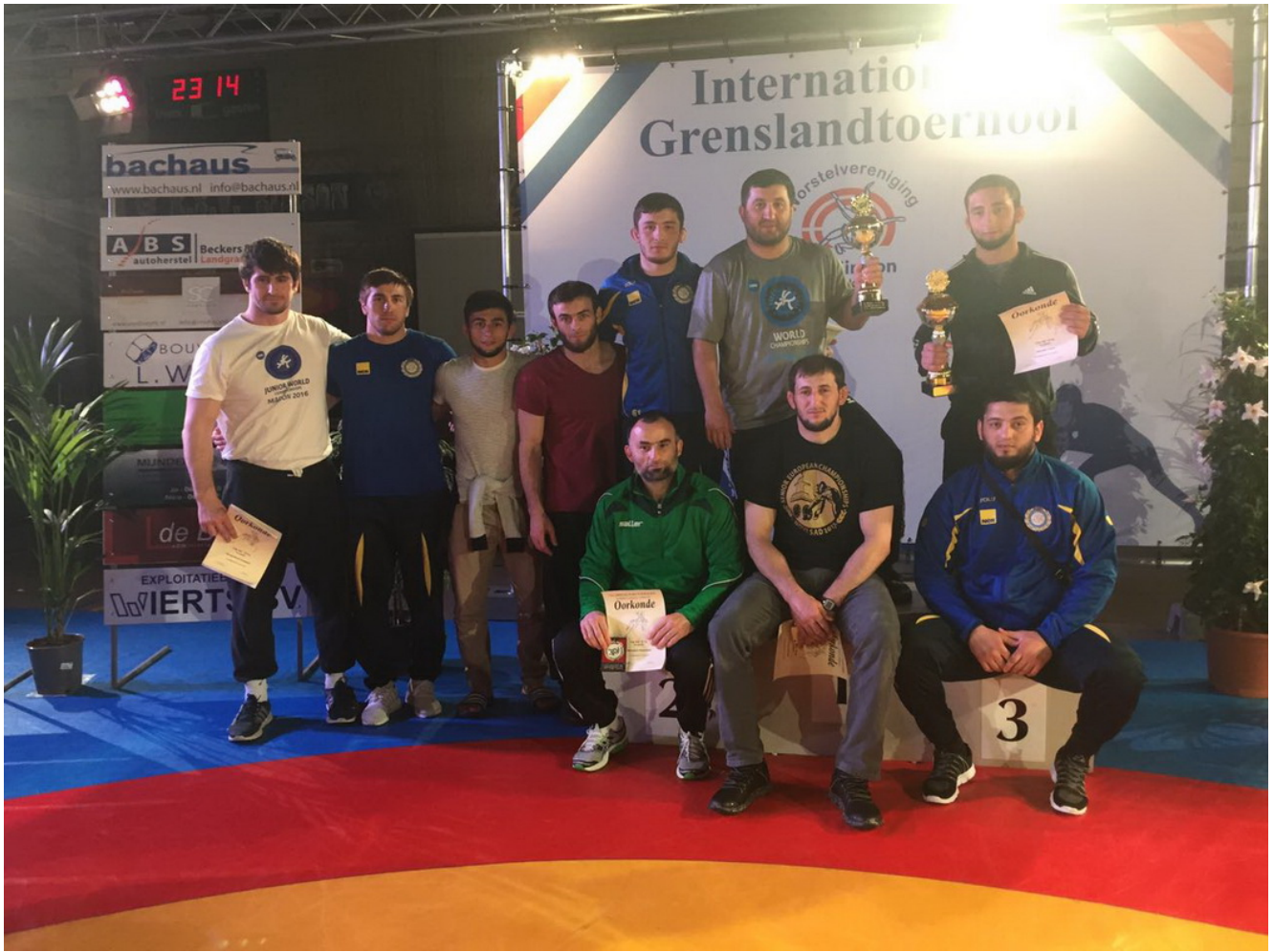
Вайнахские спортсмены после соревнований