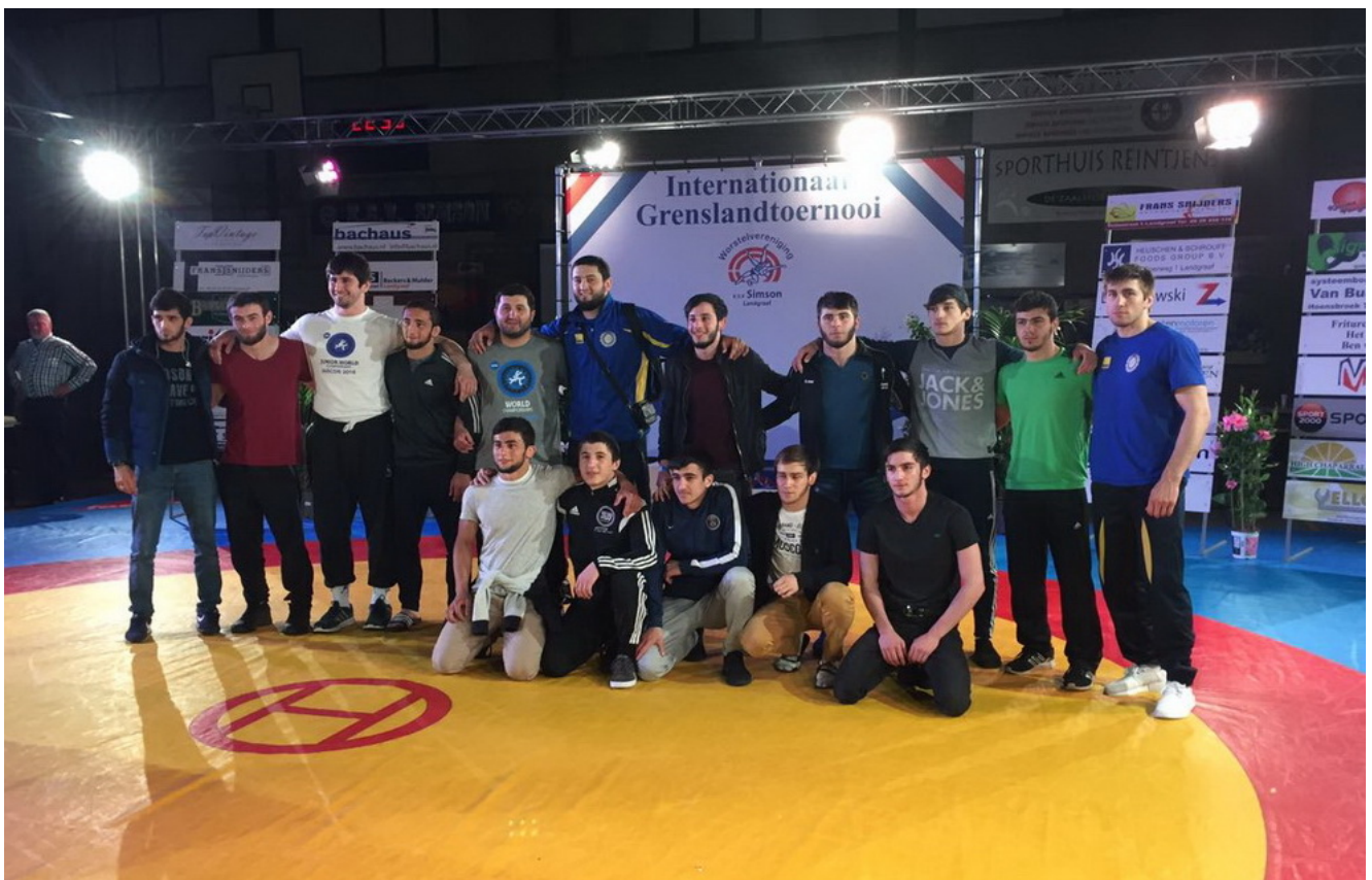
Вайнахские спортсмены после соревнований