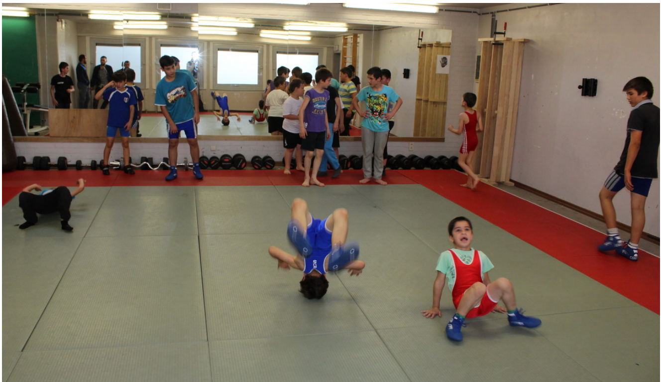
Борцы клуба "Чемпион" (Катріоен) на треніровкe