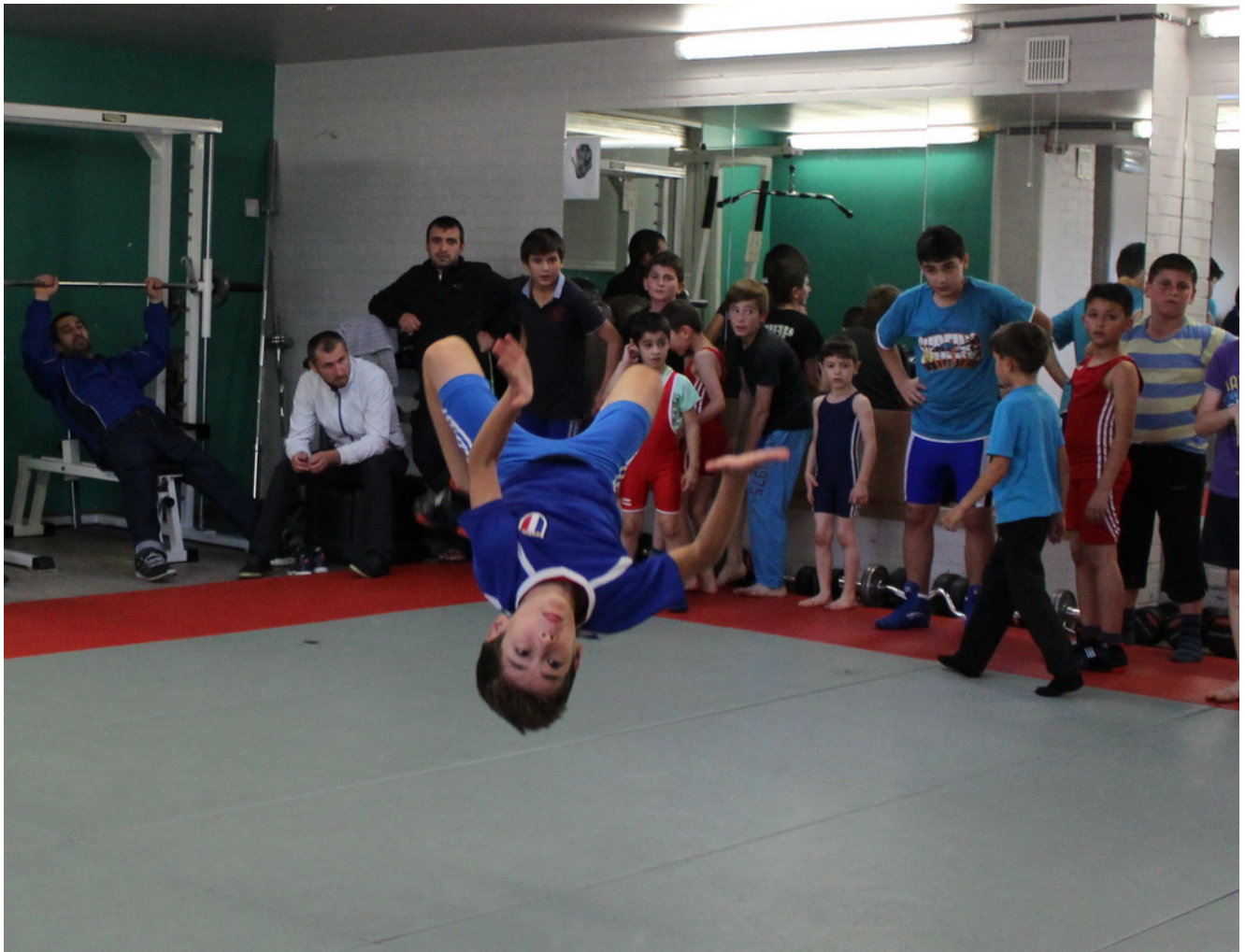
Борцы клуба "Чемпион" (Катріоен) на треніровкe