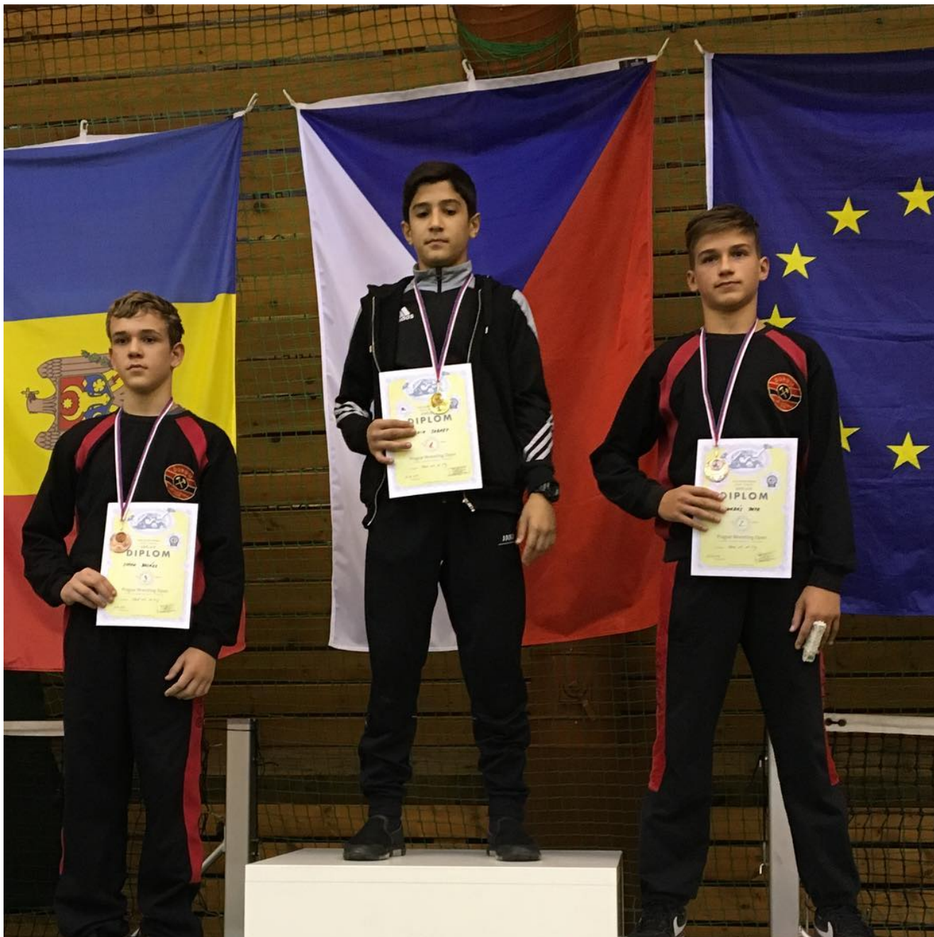
Чемпион Прага-Опен Ибрахим Табаев