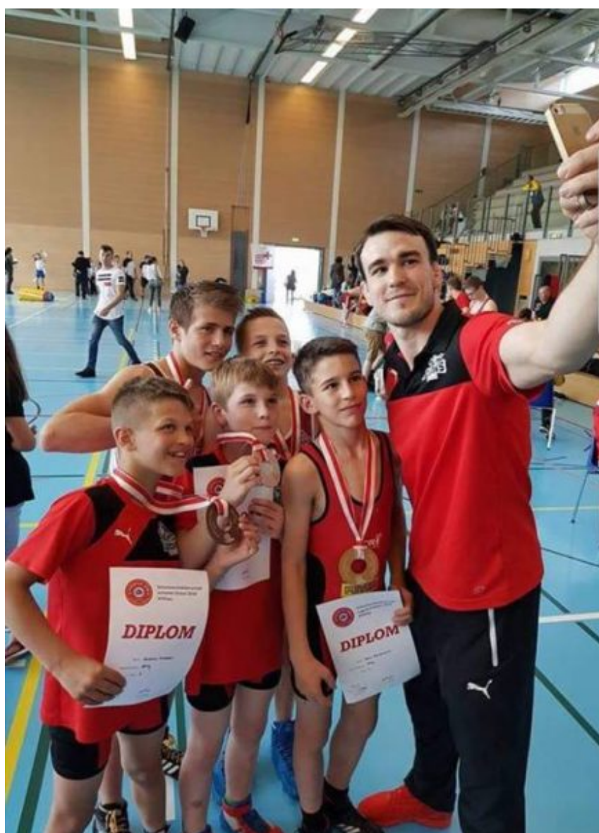
Команда клуба Виллизау после соревнований