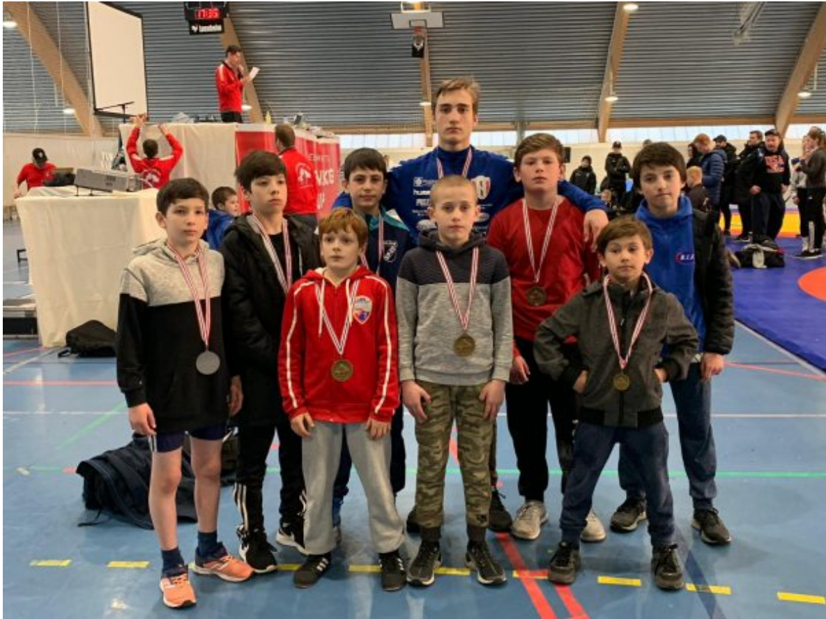
Вайнахские спортсмены после соревнований