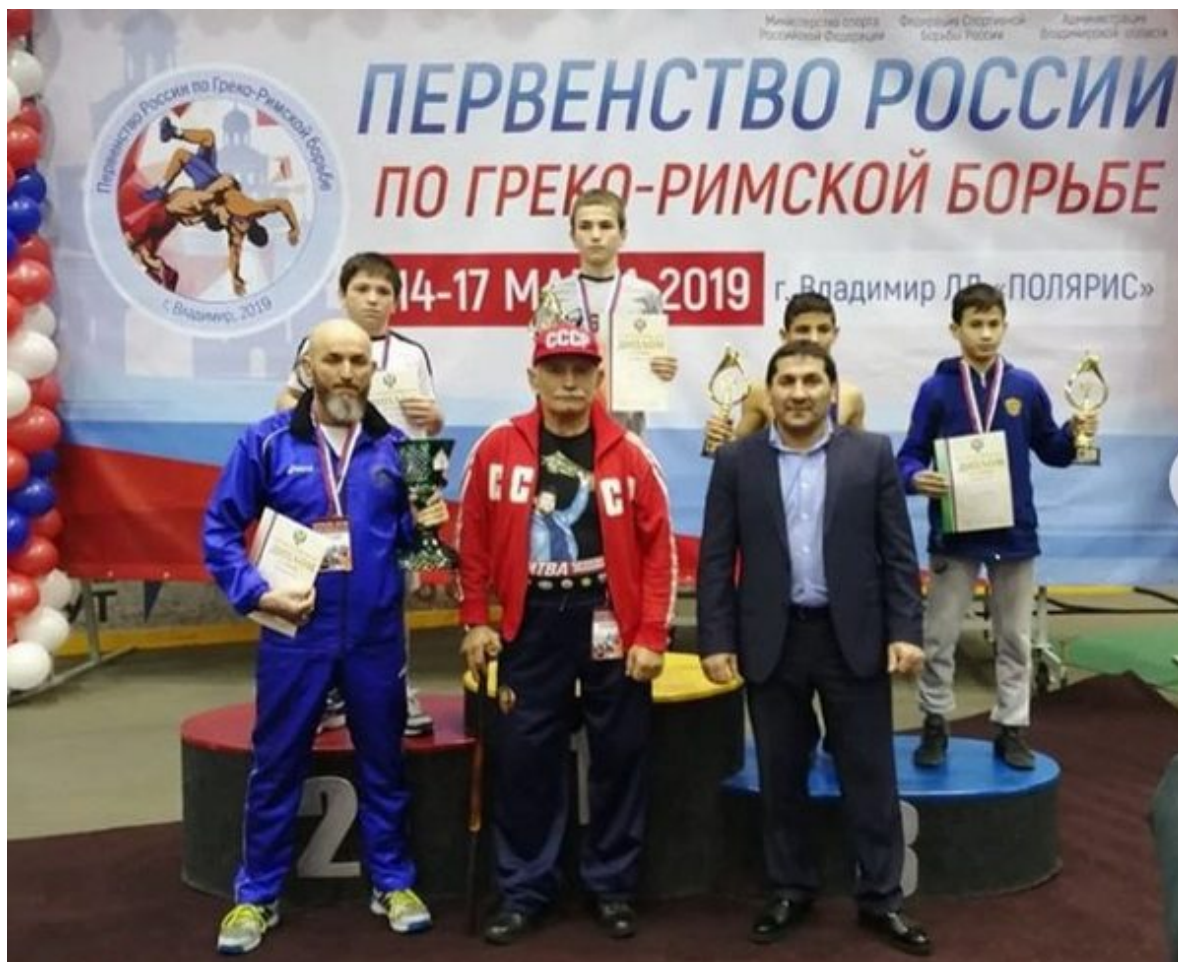
Чемпион России Усман Эскерханов.

[button color=»light» link=» https://wsport.su/wp-content/uploads/2019/03/rosgr.pdf » target=»»]Победители и призеры первенства России-2019[/button]