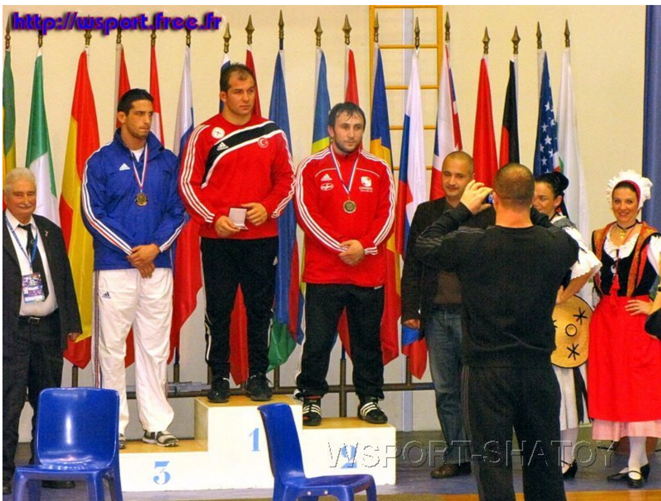
Награждение категории 96 кг