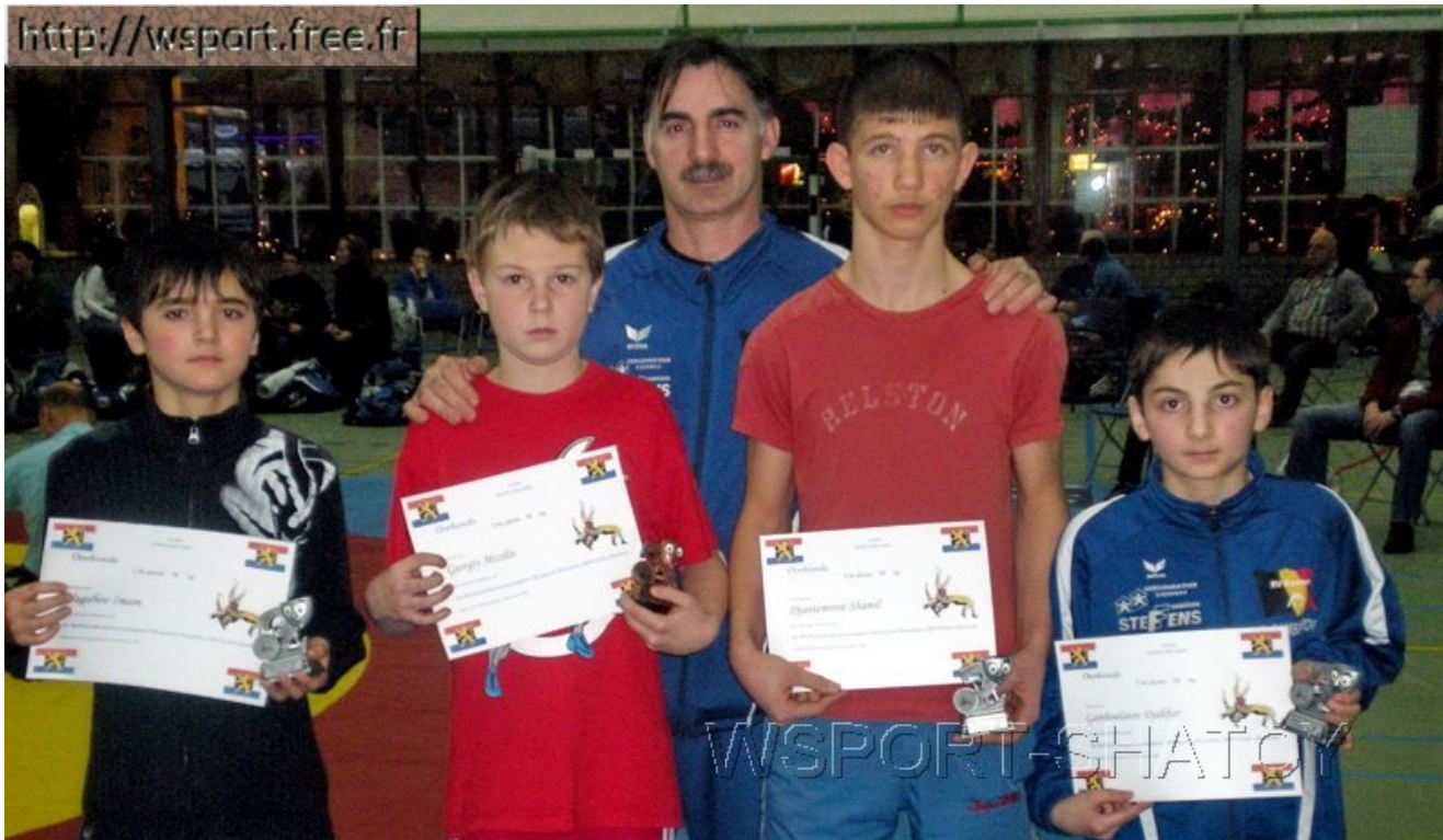
Команда спортклуба "Раерен 2006"