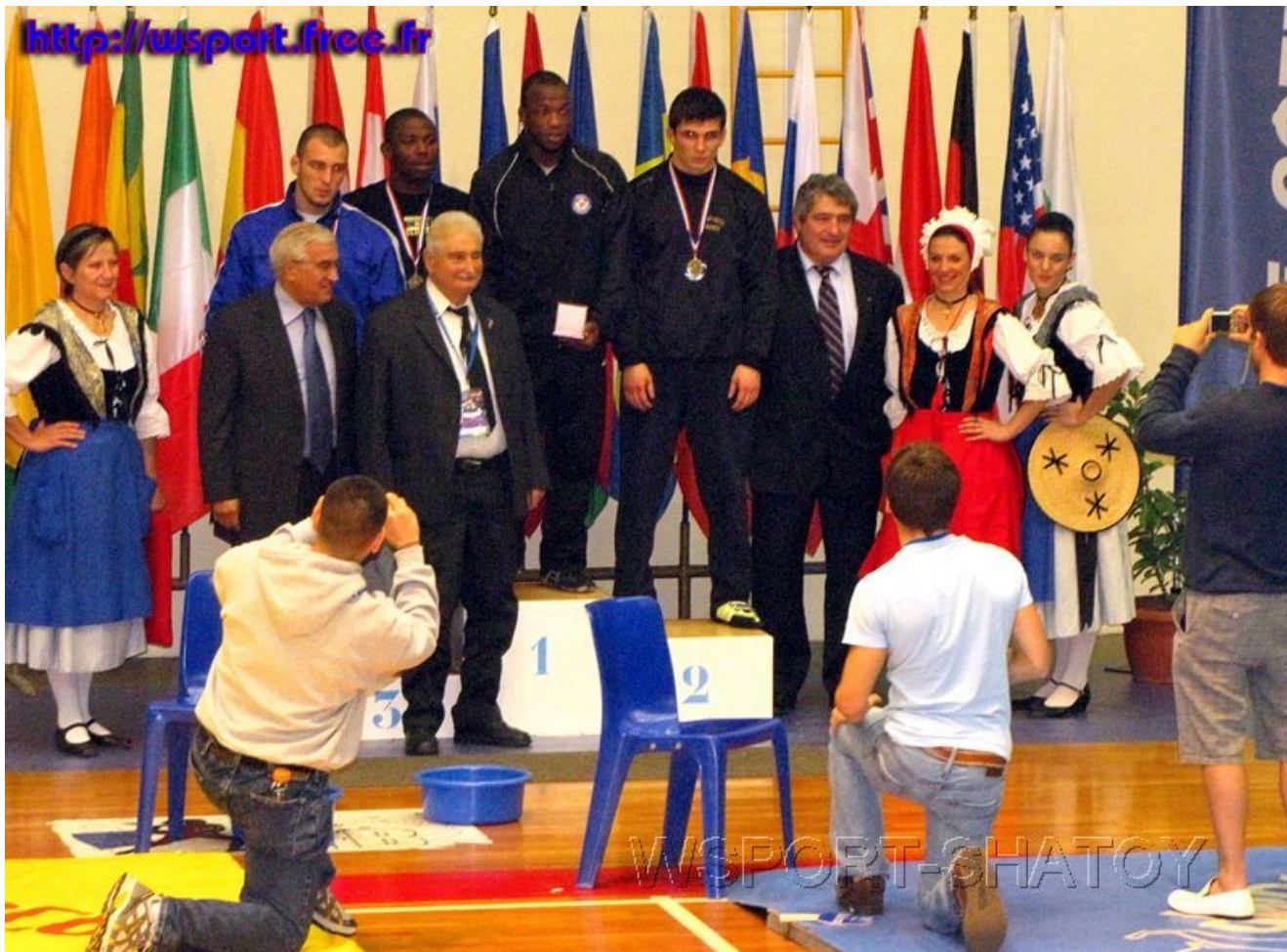
Награждение категории 74 кг