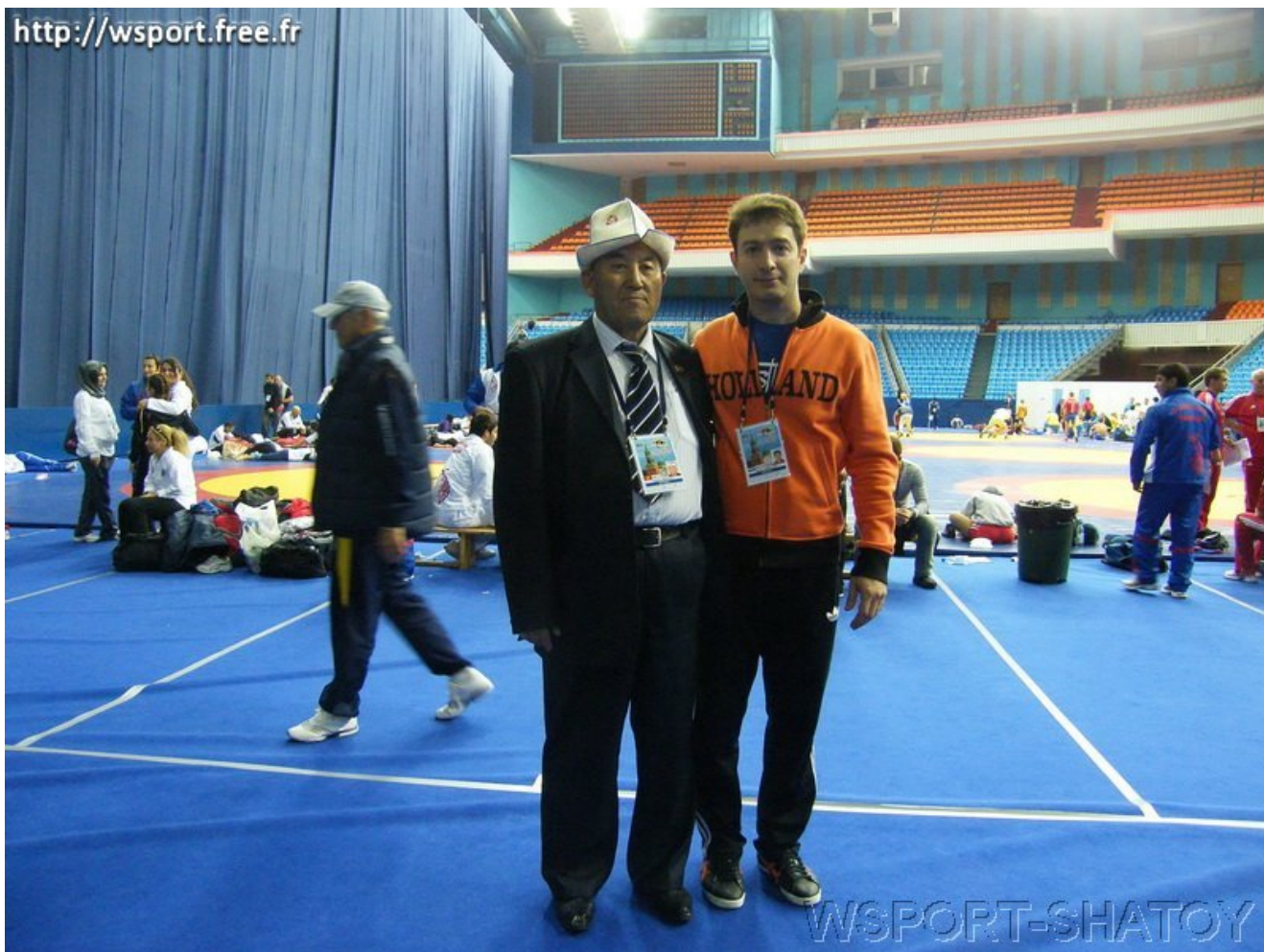
Представитель Федерации спортивной борьбы Кыргызстана