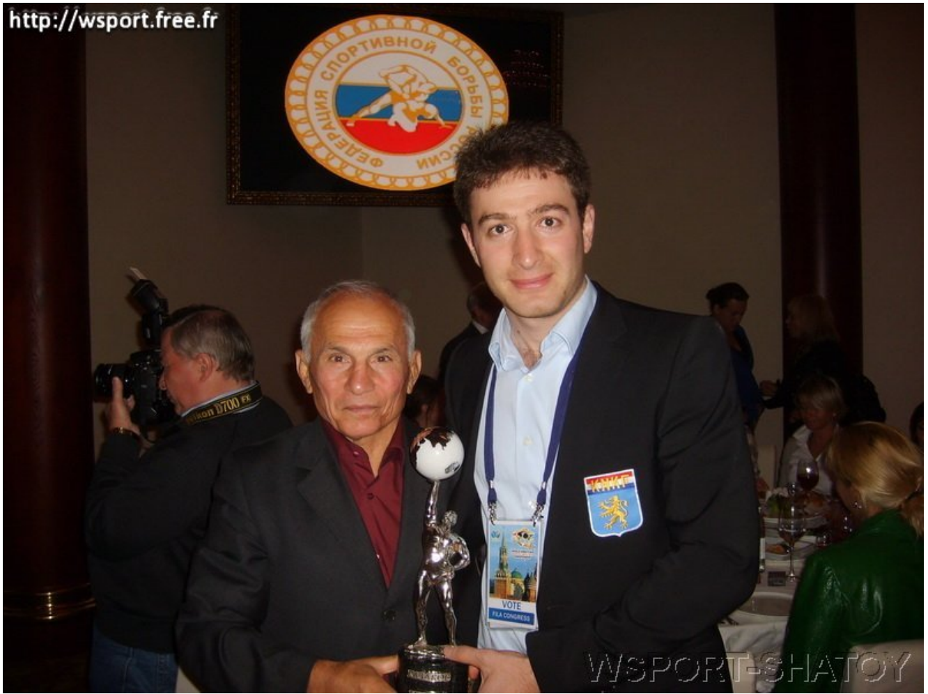
Олимпийский чемпион Рустем Казаков и Айдамир