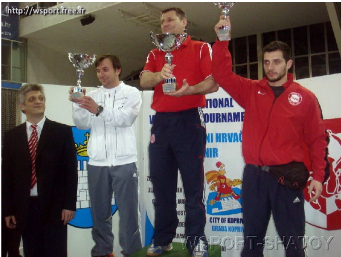
Команда из Вервье заняла второе общекомандное место