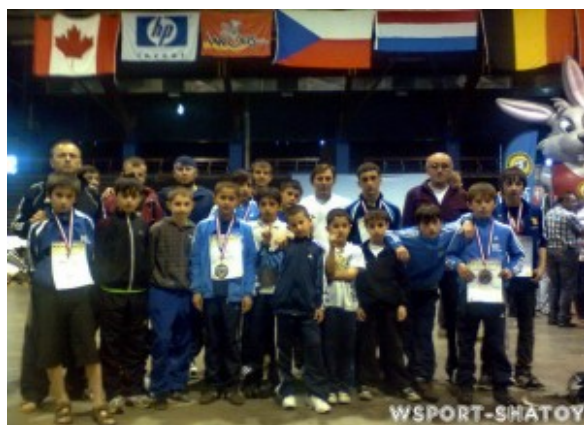
Борцы из Бельгии