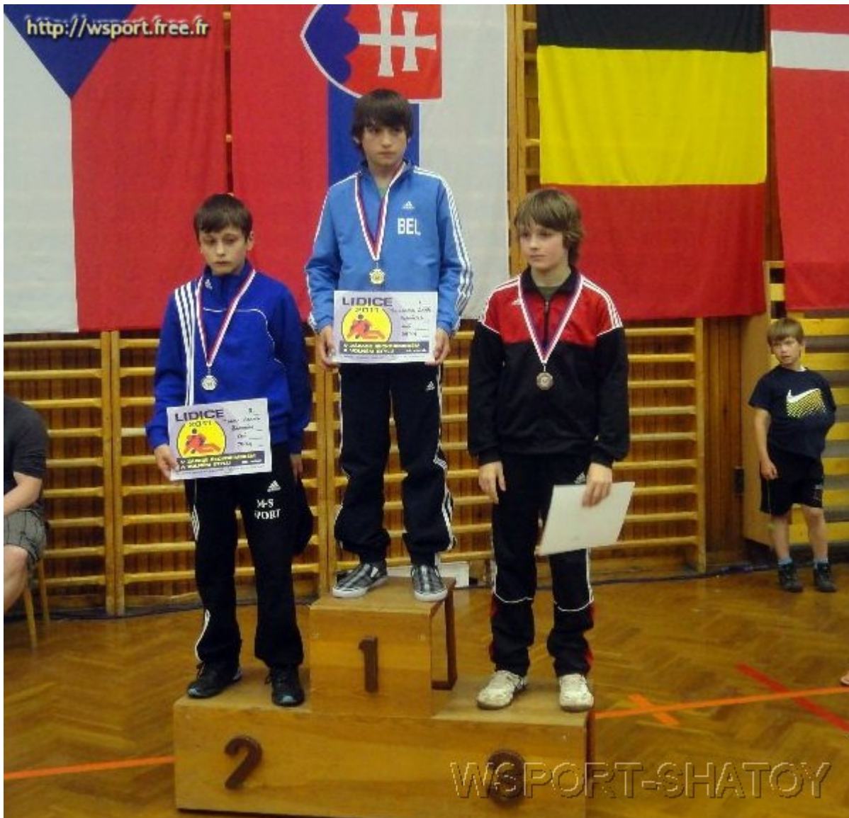
Чемпион Запир Юсупов