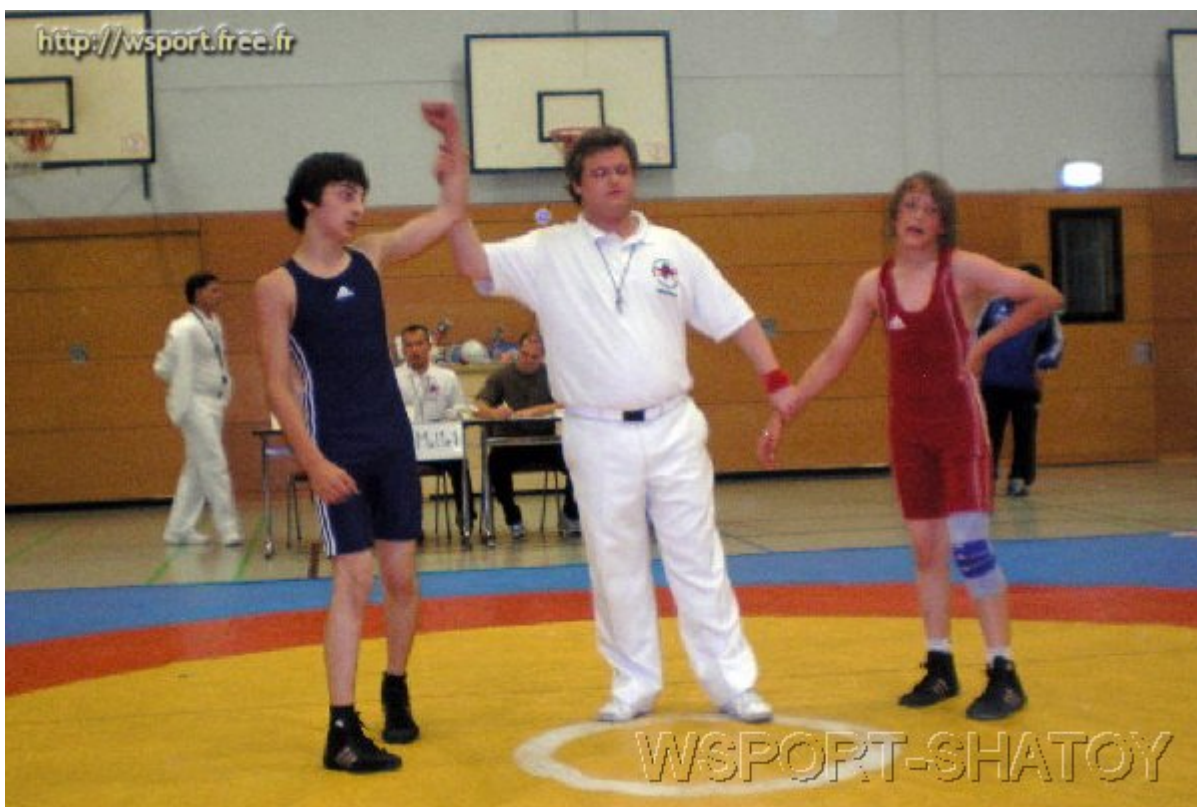
Джохар Гамбулатов выигрывает у Карстена Вегнера