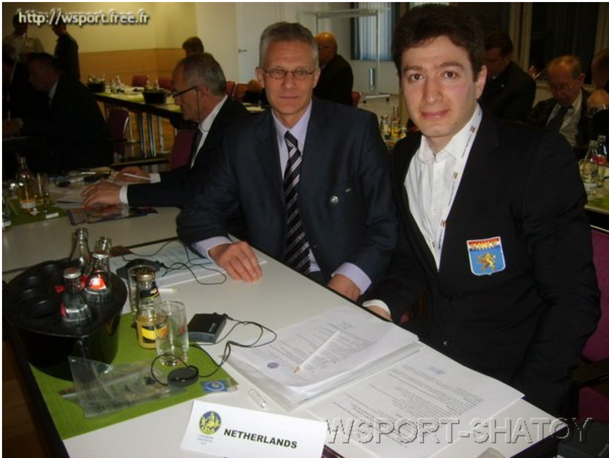
Делегаты Голландской федерации борьбы на конференции CELA: