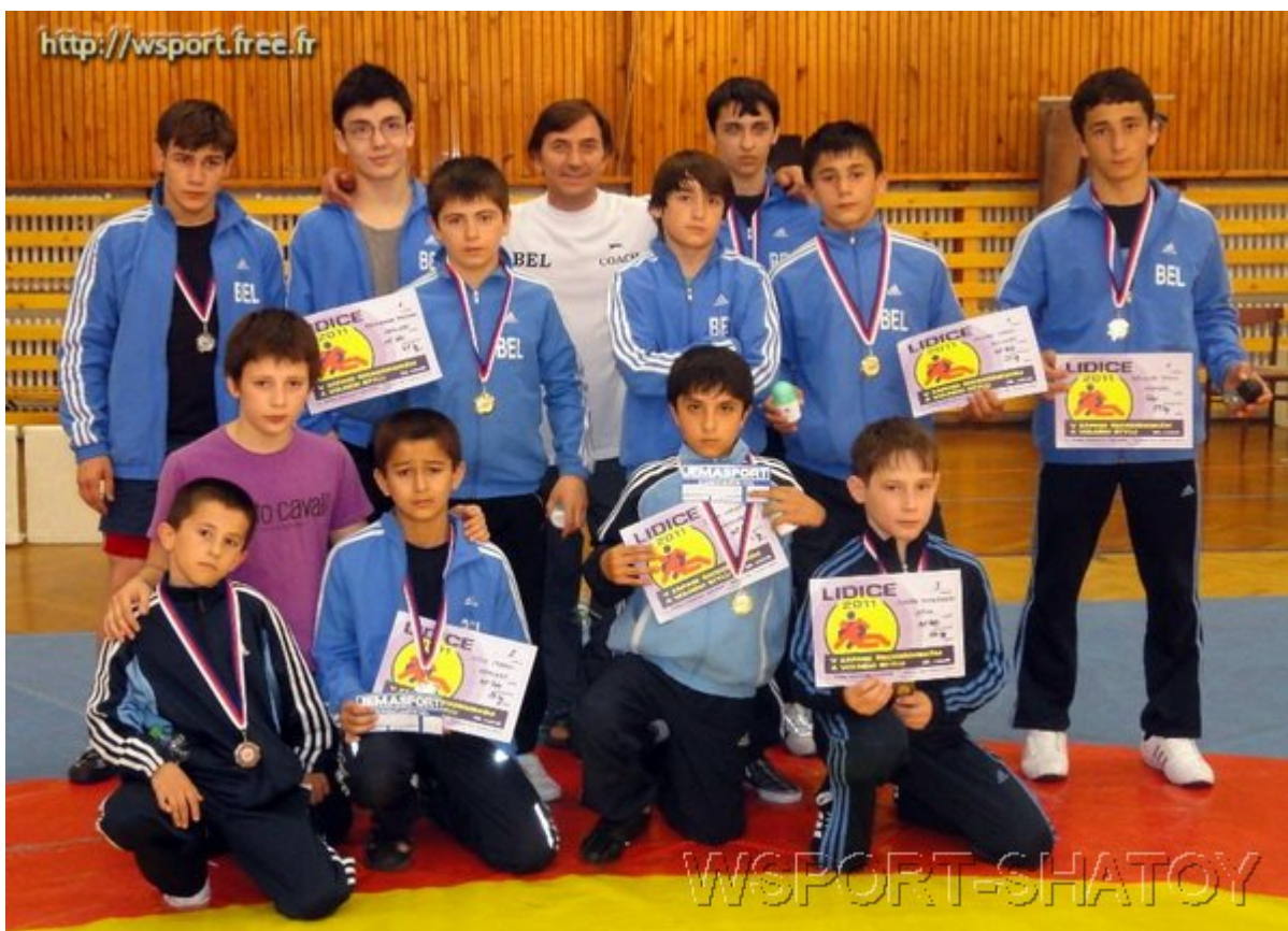
Команда спортклуба Вербье