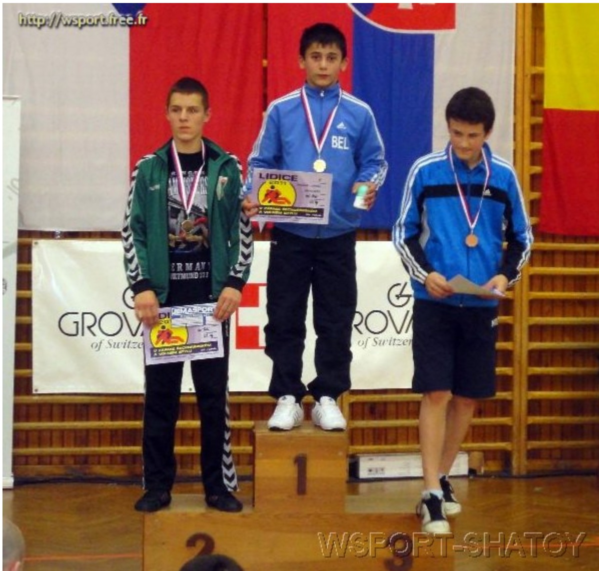
Чемпион Якуб Томов