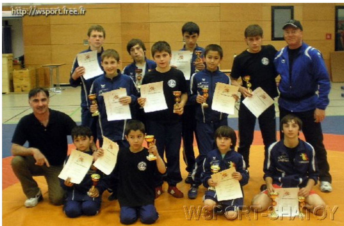
Команда "Paeren 2006"