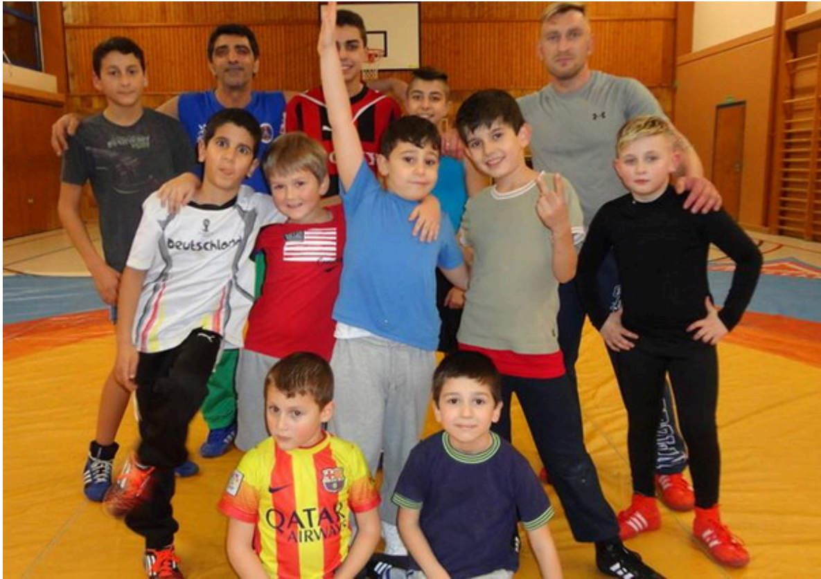
Борцы из клуба Людвигсхафена.