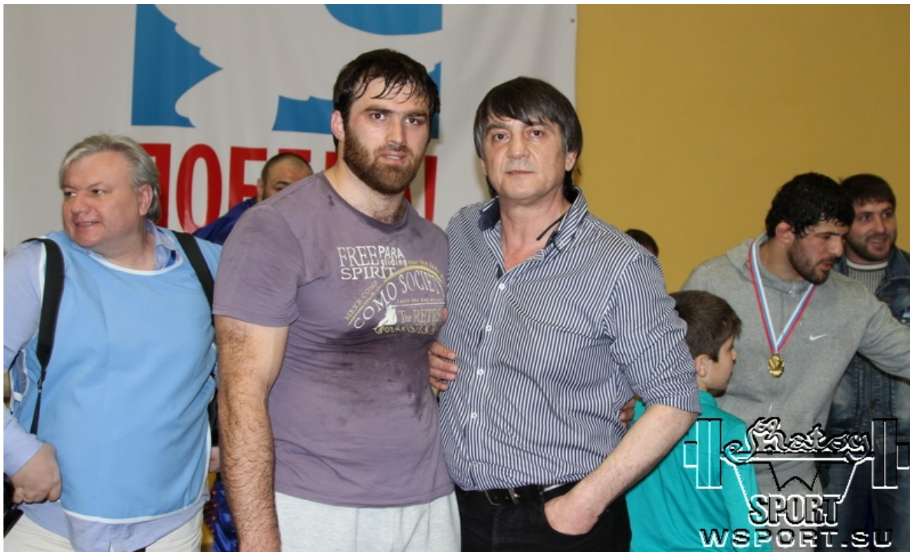
Бекхан Дукаев с абсолютным чемпионом мира-89 Ахмедом Атавовым