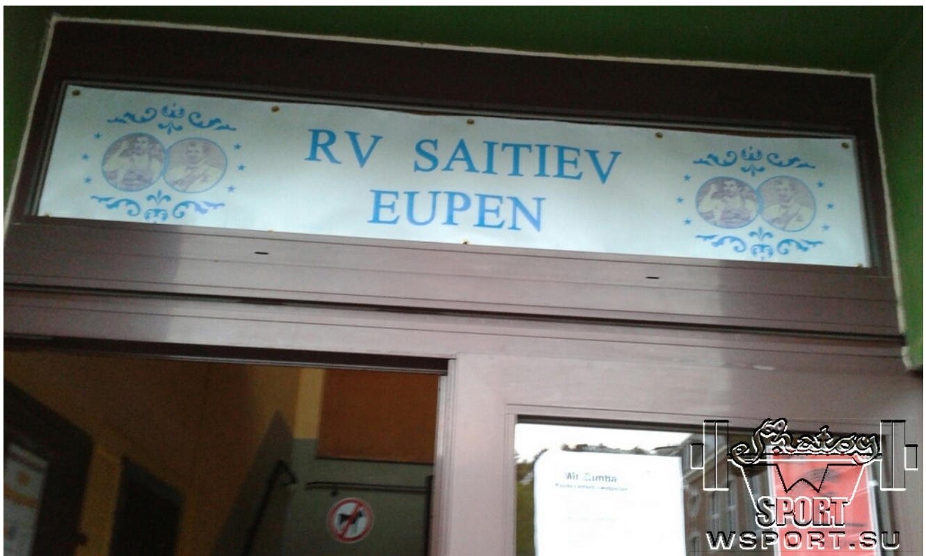
Вход в зал