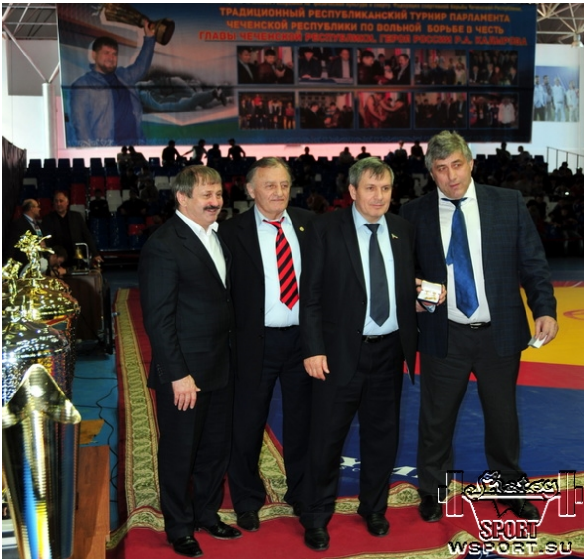
2013 год. Чемпион мира и Европы-1987, серебряный призер Олимпиады-1988 Адлан Вараев, Дэги Багаев, председатель Парламента ЧР Дукуваха Абдурахманов, чемпион мира-1979 Хасан Орцуев на Парламентском турнире в Грозном.