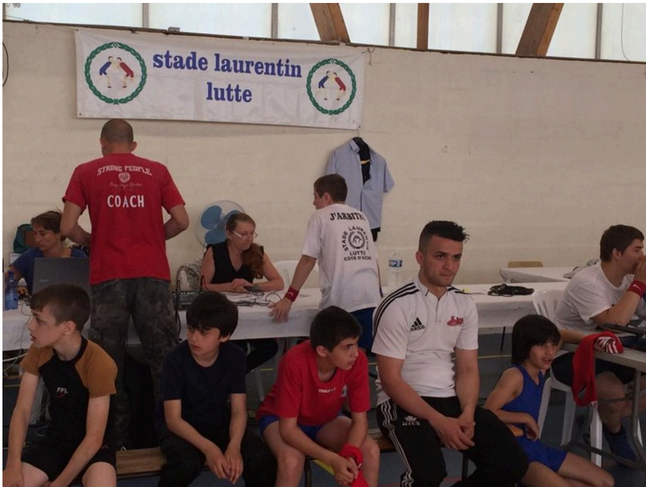
Представители Nice Club de Lutte на турнире