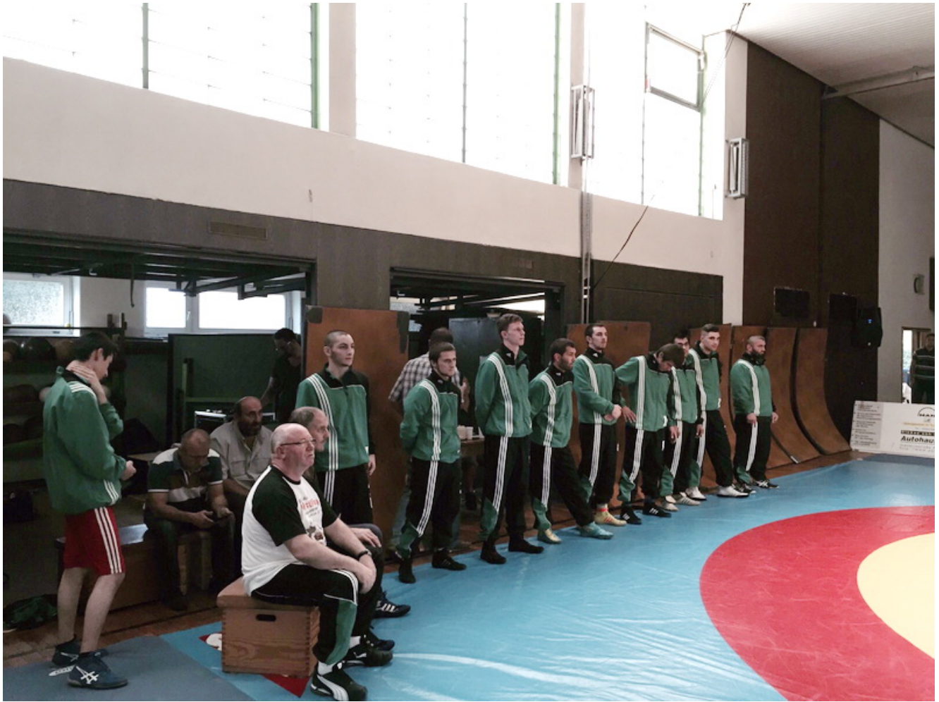
Команда RG Oberforstbach/ Sparta Kelmis