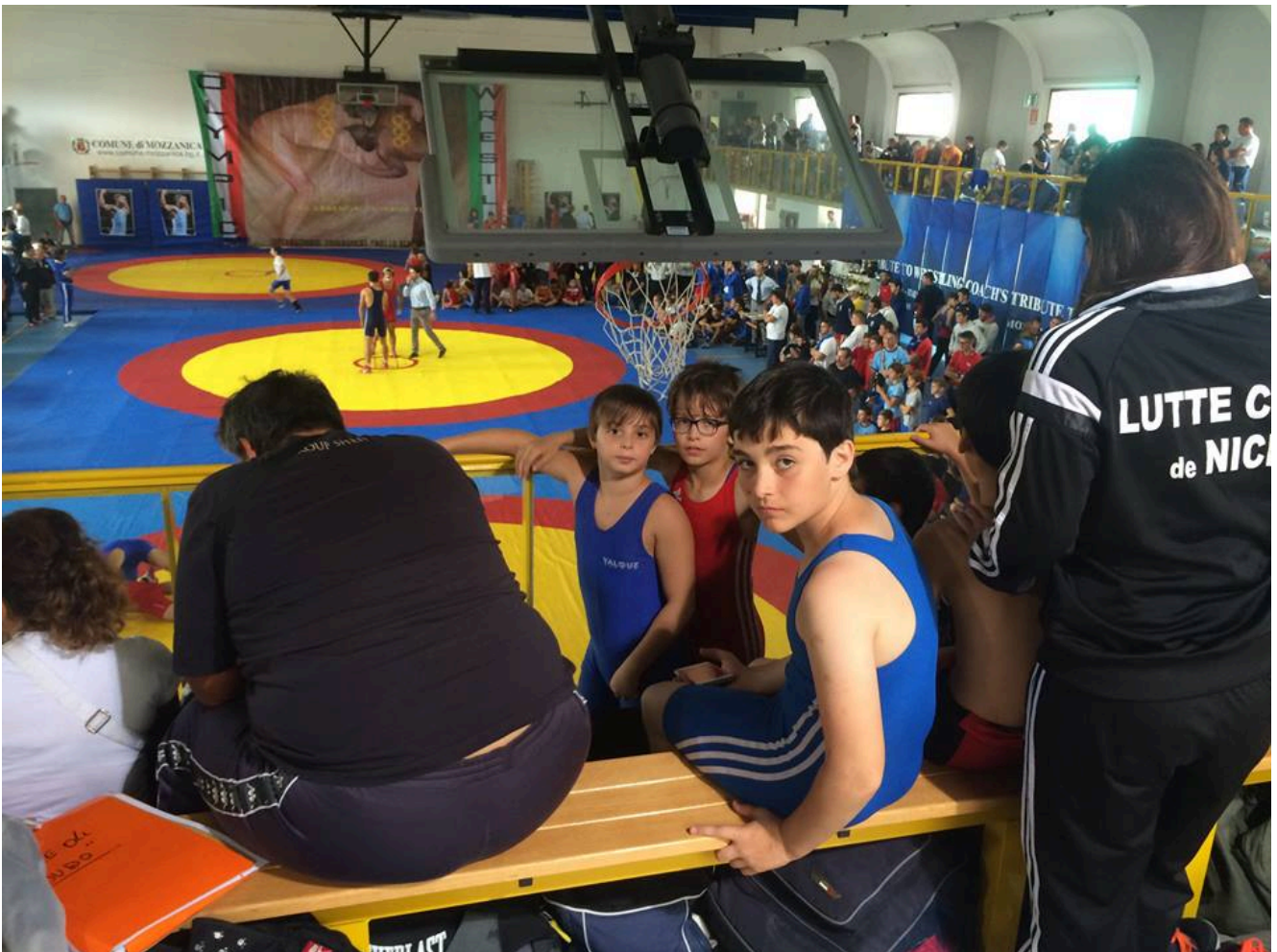
Спортсмены Wayclub в Италии