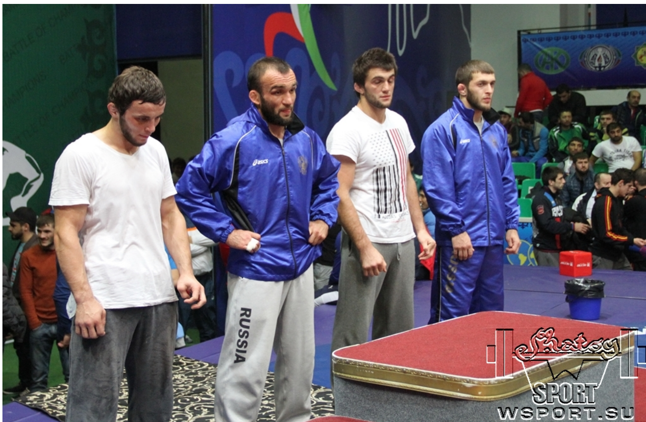
Награждение призеров категории 70 кг