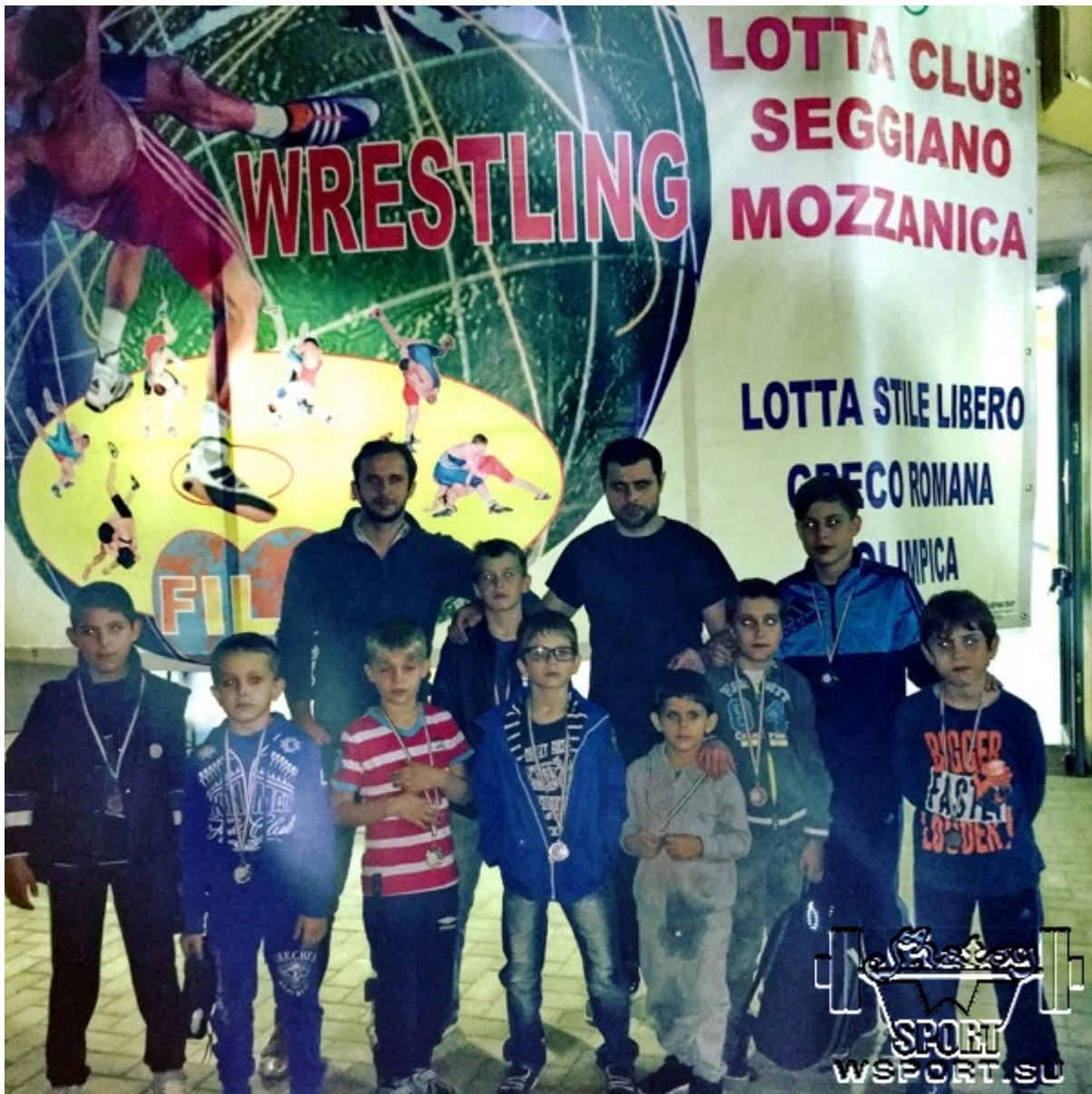
Команда Mitanni Club