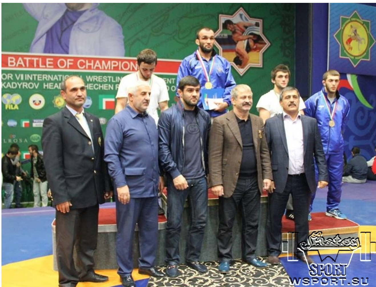
Награждение призеров категории 70 кг