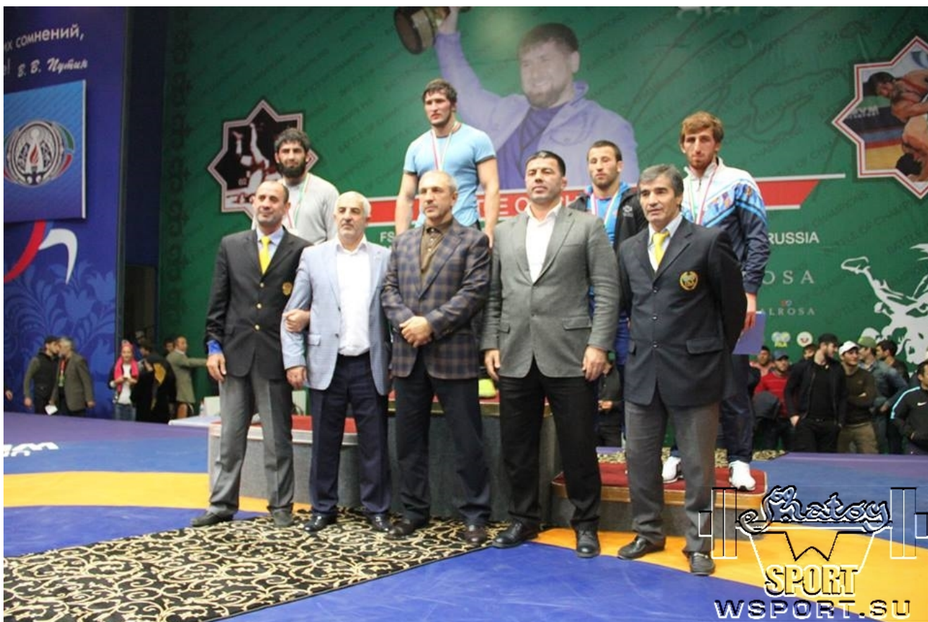
Результаты схваток за призовые места: