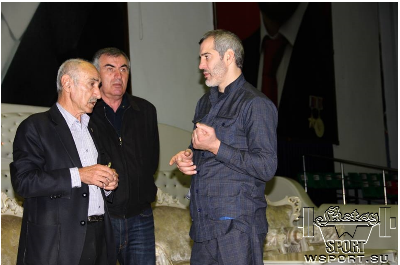
Решение последних оргвопросов