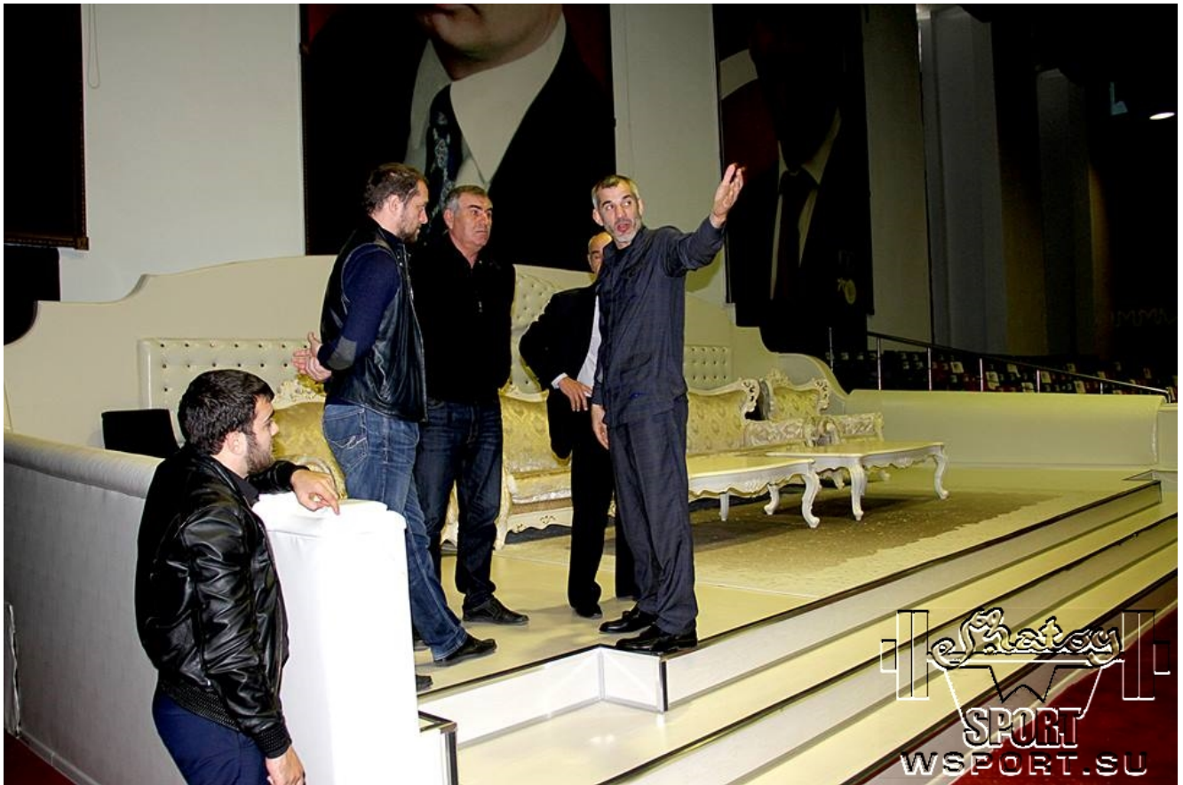
Решение последних оргвопросов