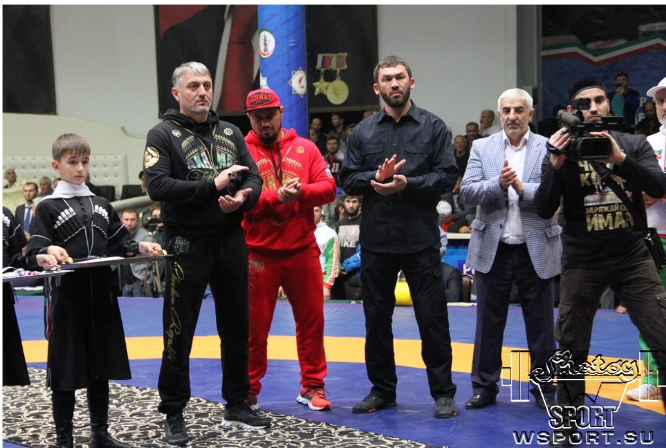
Награждение призеров весовой категории 74 кг