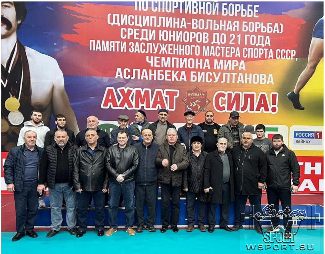
Знаменитые ветераны, тренеры, функционеры, журналисты на Мемориале Асланбека Бисултанова.