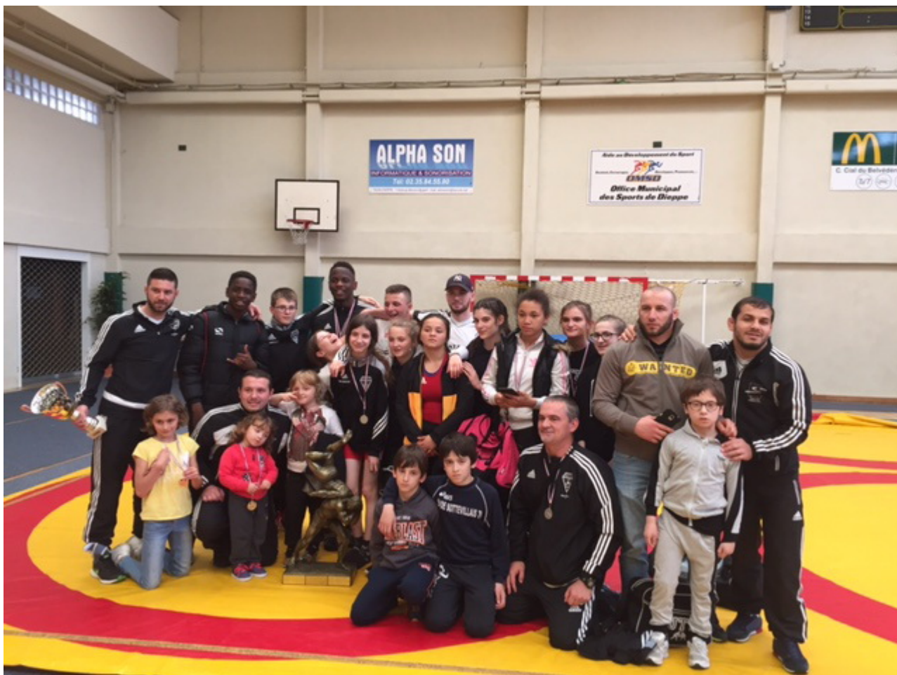
Юношеская команда клуба из Соттевиль-ле-Руан