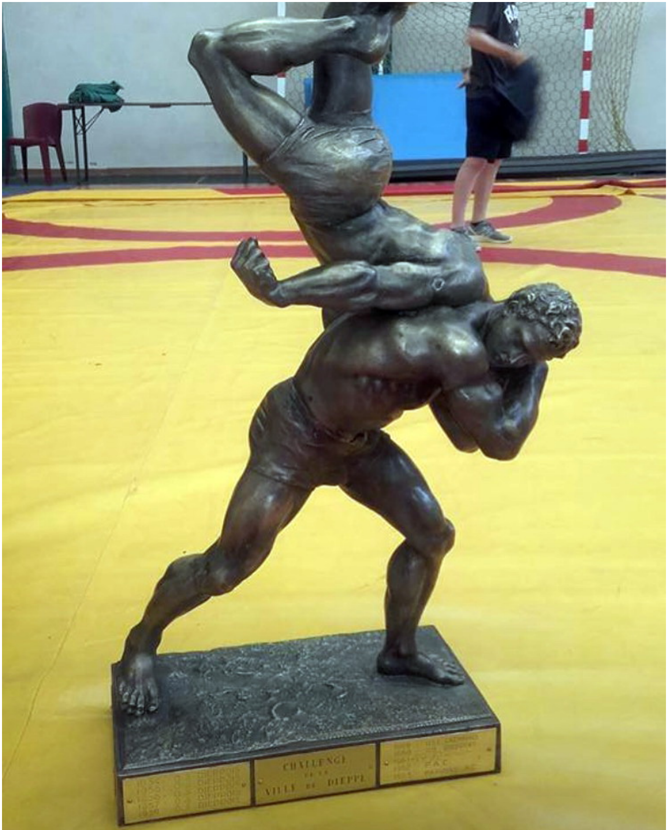
Переходящий Кубок турнира