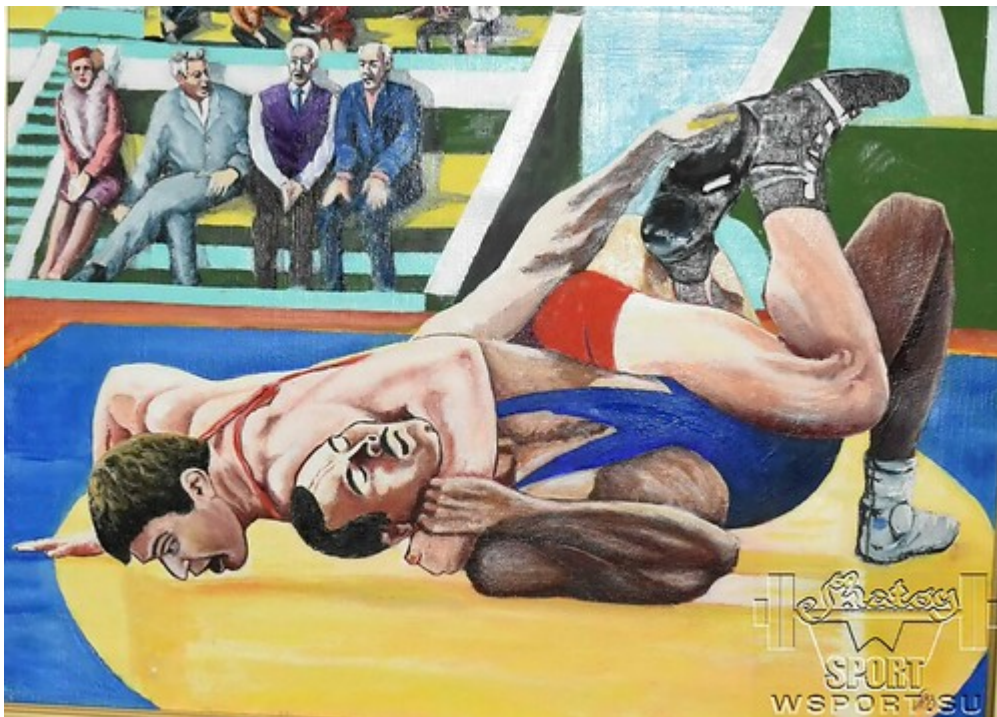
Для просмотра альбома кликнуть на фото ниже .