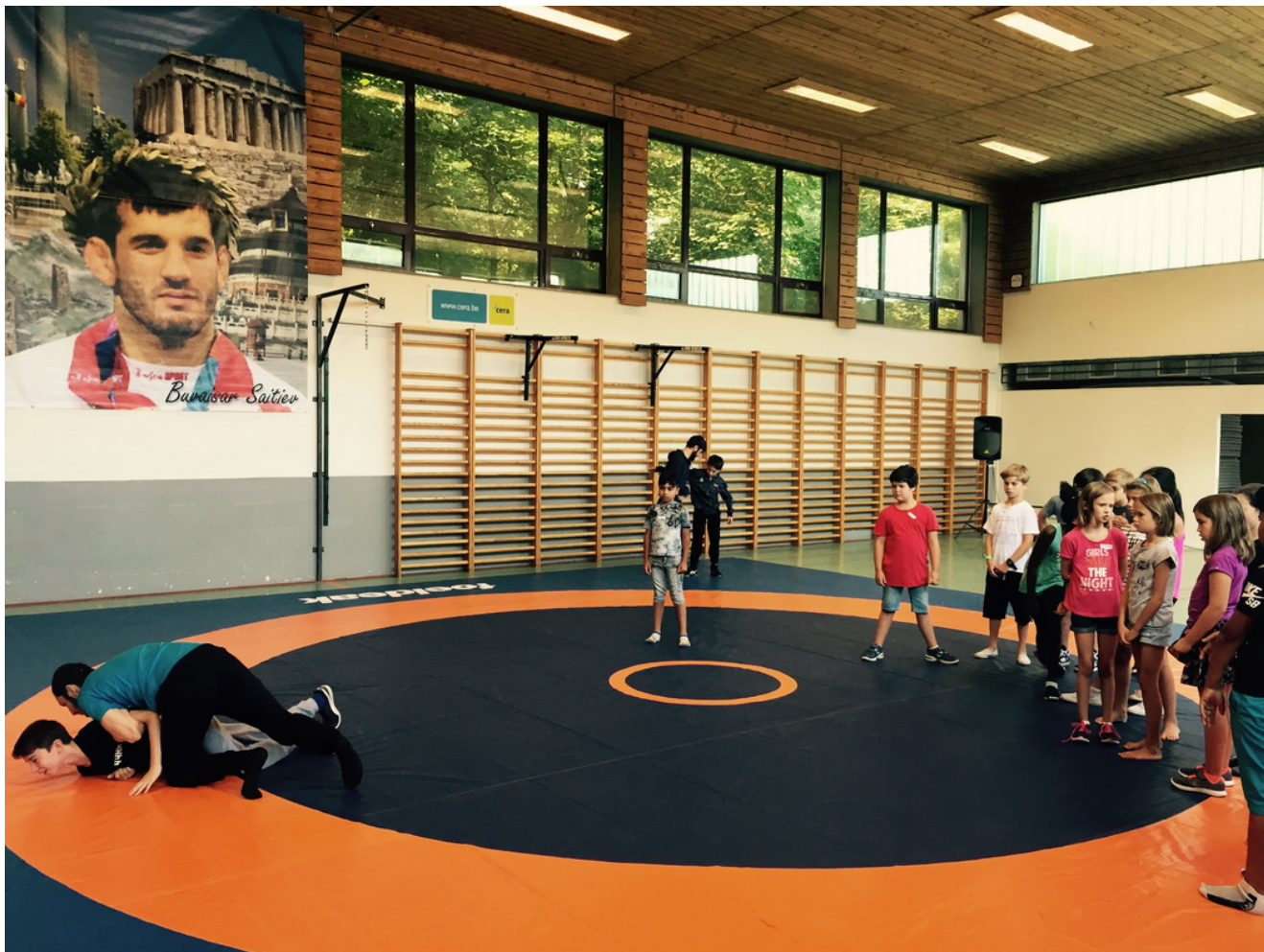
Открытая тренировка в БК Сайтиев.