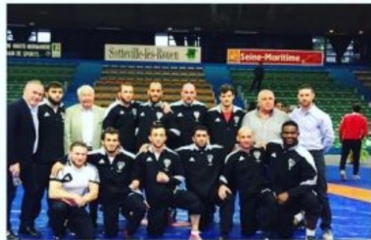
Команда Соттевиль-ле-Руан на клубном чемпионате Франции-2017