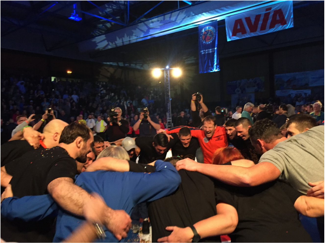
Команда Испринген радуется победе.