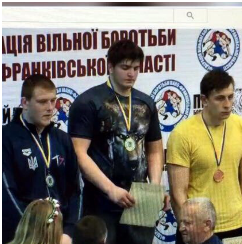
Чемпион Украины Магомед Закариев