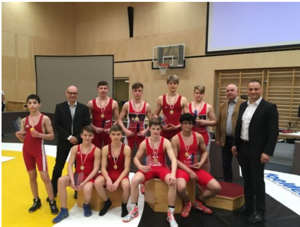
Победители первенства Австрии в вольной борьбе.