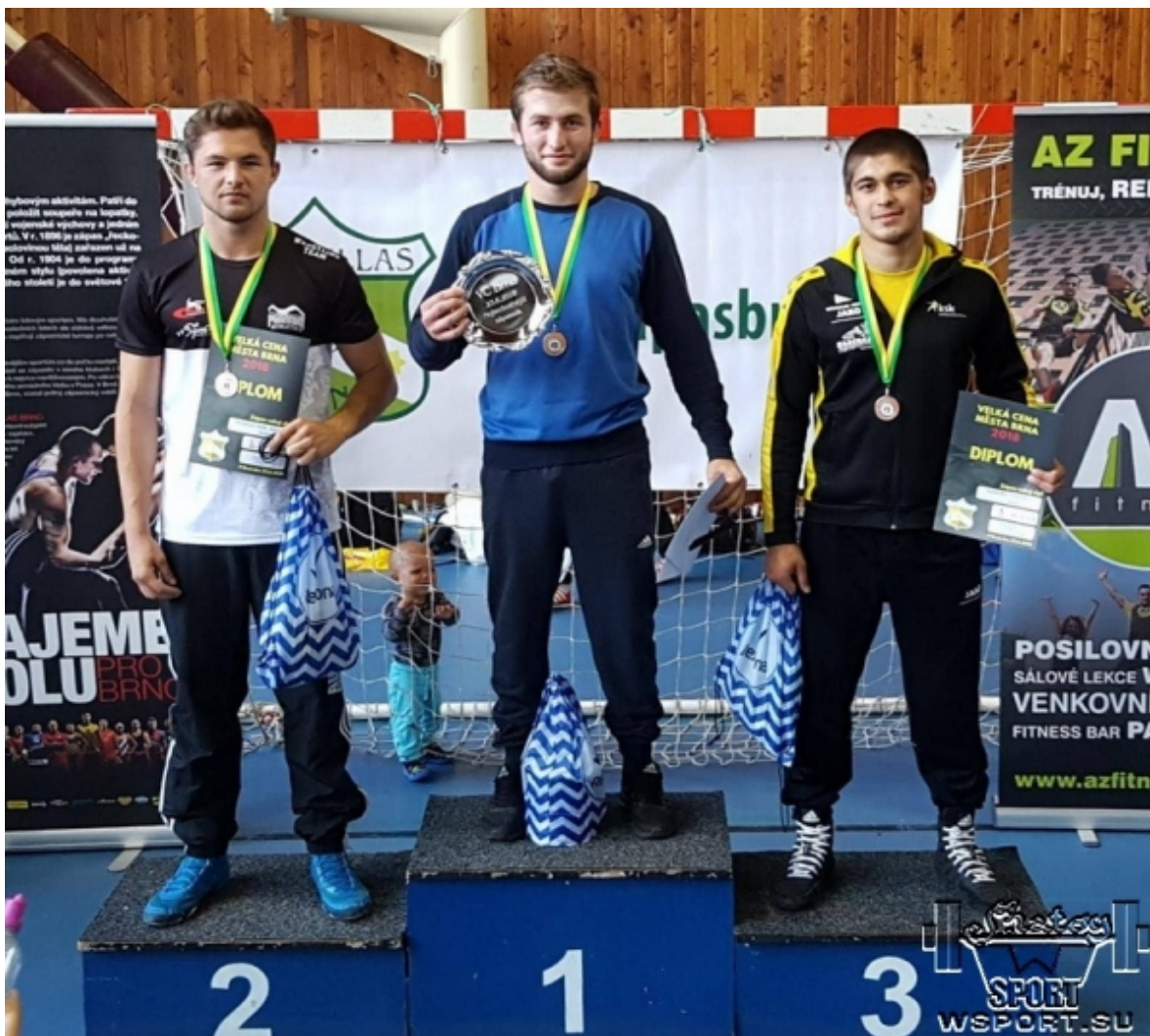
Магомед Шуаипов – бронзовый призер Гран При Брно 2018