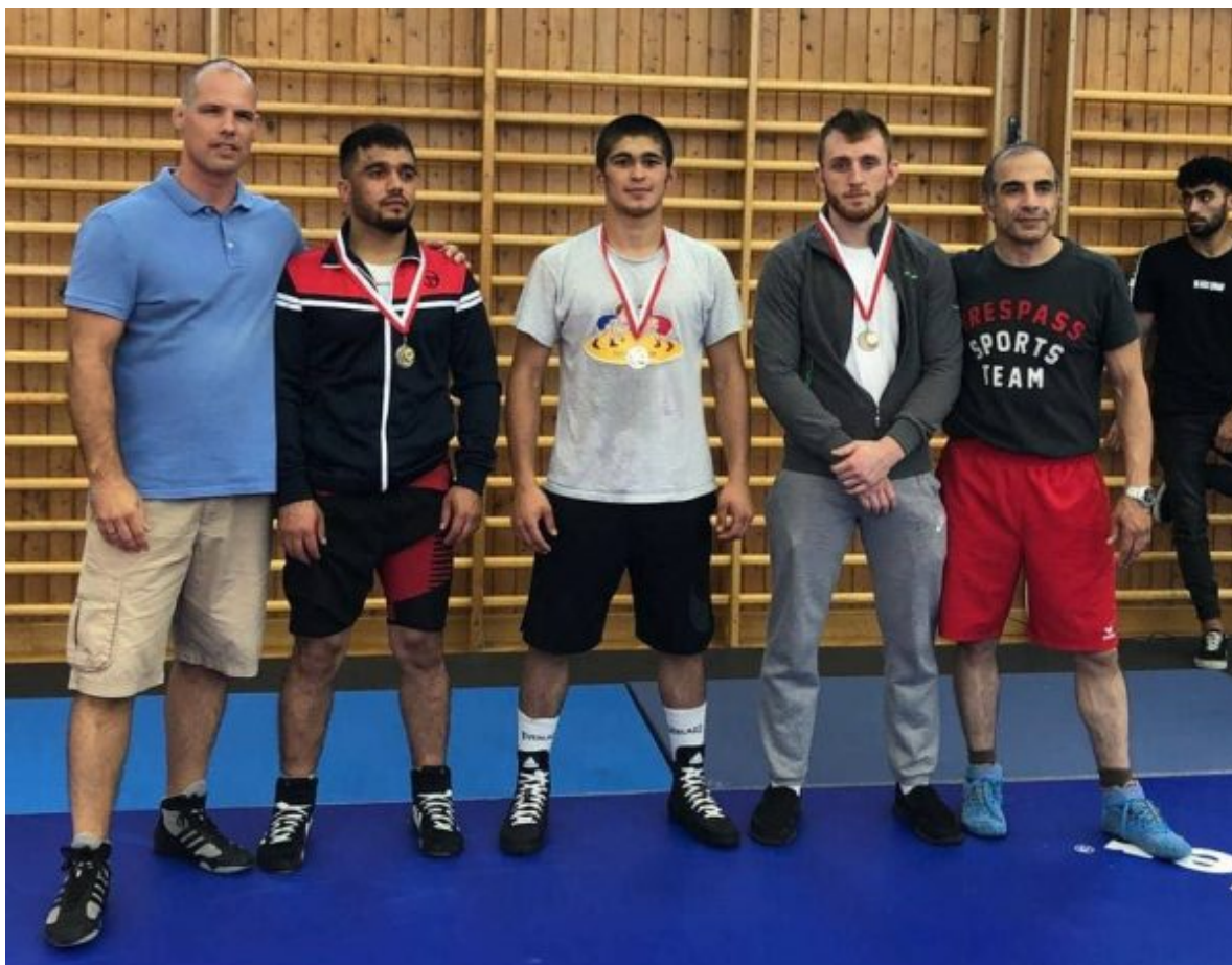
Вайнахские борцы на чемпионате Вены-18